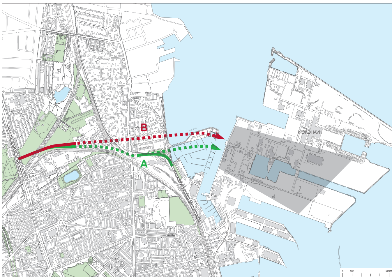
Vejforslag A og B. Fuldt optrukket linje viser vej i terræn, stiplede linje er vej i tunnel. Det grå felt i Nordhavn angiver det område hvor indenfor vejen kan tilsluttes.

Fra tilslutningsanlægget ved Helsingørmotorvejen frem til Svanemøllens kaserne er Vejforslag A og B ens.