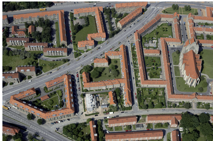
I områder med meget homogene tagformer og -højder er opsætning af møller arkitektonisk problematisk.

Ved behandlingen af byggetilladelsen vurderer kommunen blandt andet ansøgningen i henhold til bestemmelserne i en eventuel lokalplan. Kommunen vurderer endvidere opsætningen af tagvindmøller i henhold til § 6 d i byggeloven.