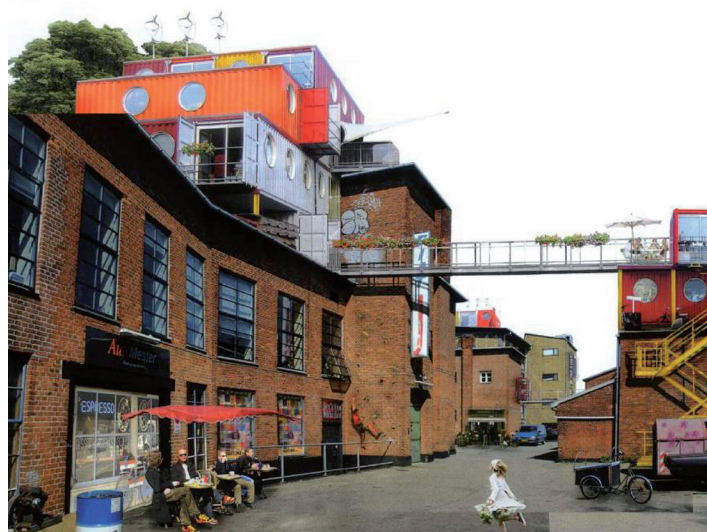
Områder med forskellig taghøjder, flade tage - og tage med tekniske installationer er mest velegnet til opsætning af møller.