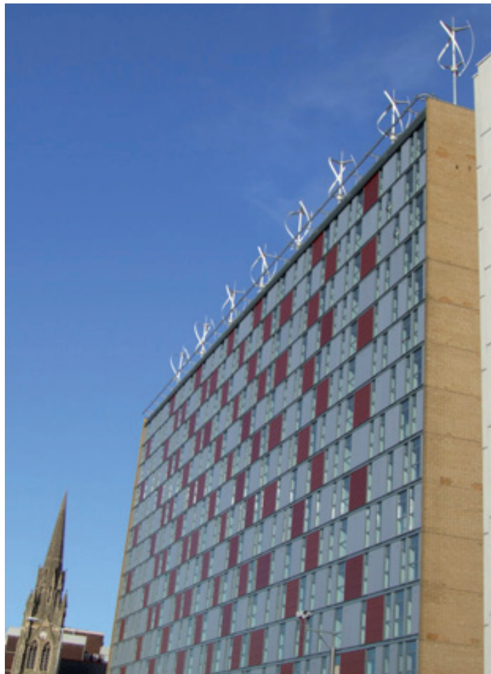
Møller opsat på høje huse, hvor vinden er stærkest.