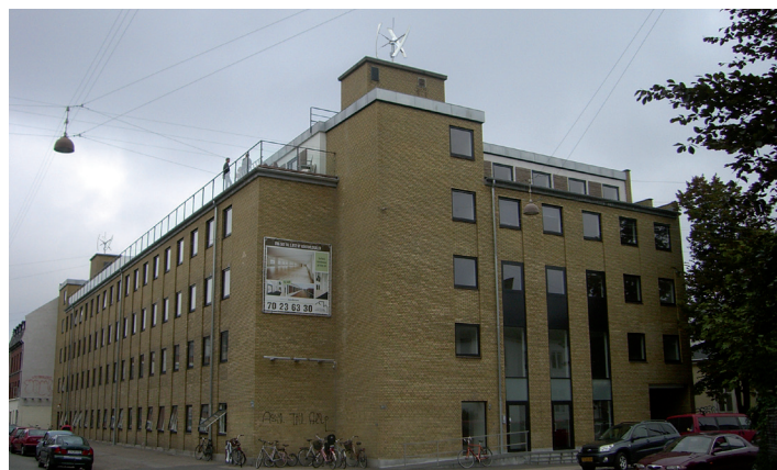
Møller kan opsættes, så de understreger vertikale elementer i arkitekturen