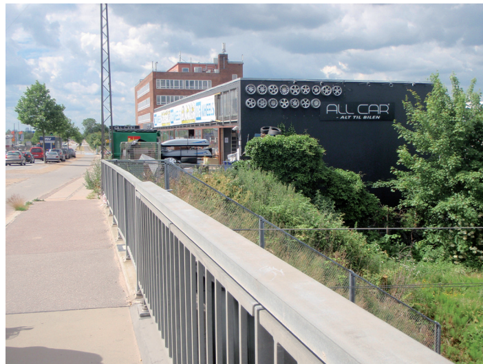
Tagvindmøller kan opsættes i grupper på indutribygninger i indutrikvarterer uden gene for naboer.

Byggeloven indeholder i § 6 D, stk. 1, en bestemmelse om, at installationer og lign. ikke må være til ulempe eller virke skæmmende i forhold til omgivelserne. Kommunen kan ved forbud eller påbud sikre dette. Kommunen kan gribe ind for at sikre en god helhedsvirkning, hvis tagvindmøllerne efter kommunens vurdering virker skæmmende i forhold til omgivelserne eller på anden vis virker generende.