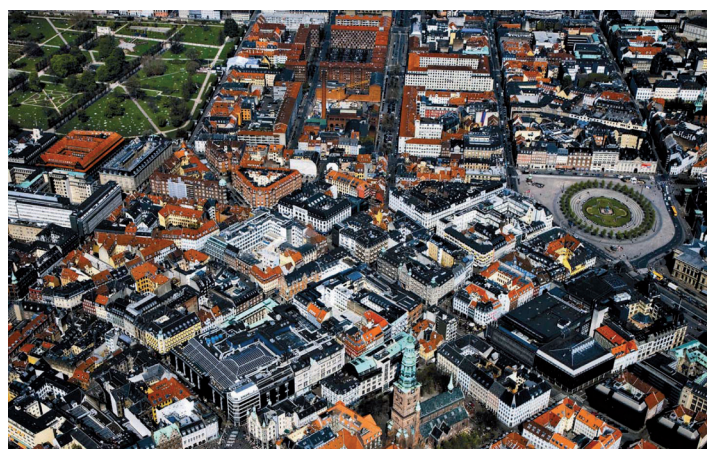
I Middelalderbyen vil fredninger og bevaringsværdier gøre det vanskeligt at indpasse tagvindmøller.