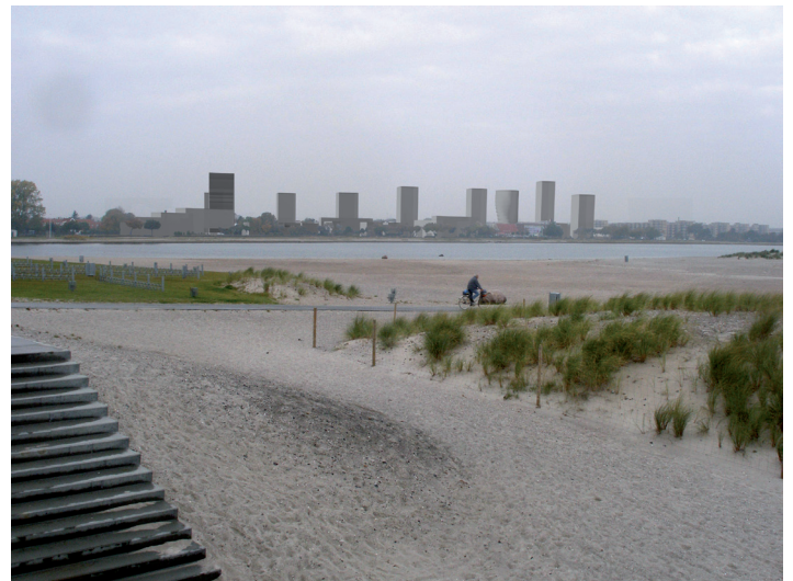
Ved nybyggeri kan møllerne indarbejdes fra begyndelsen. Her en visualisering af fremtidige højhuse på Krimsvej, Amager