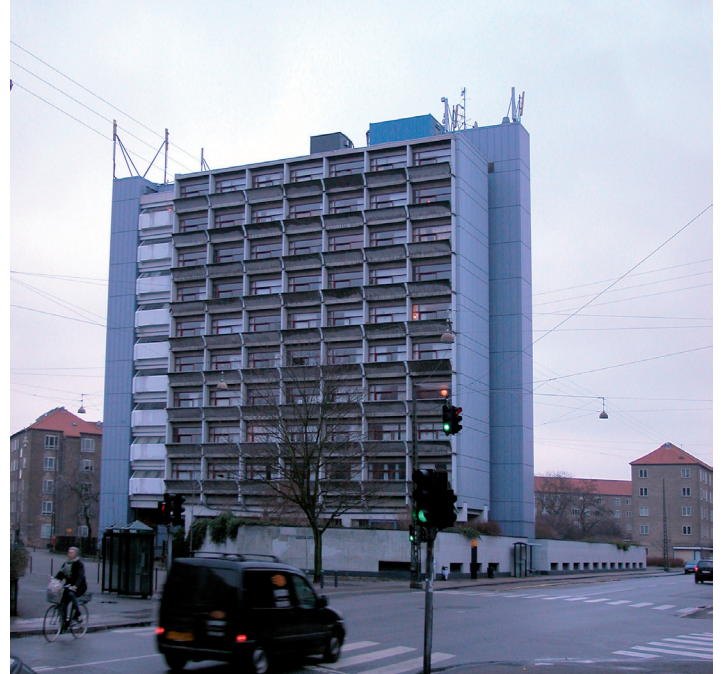
Høje huse, der i forvejen rummer tekniske installationer på taget er velegende til opsætning af møller