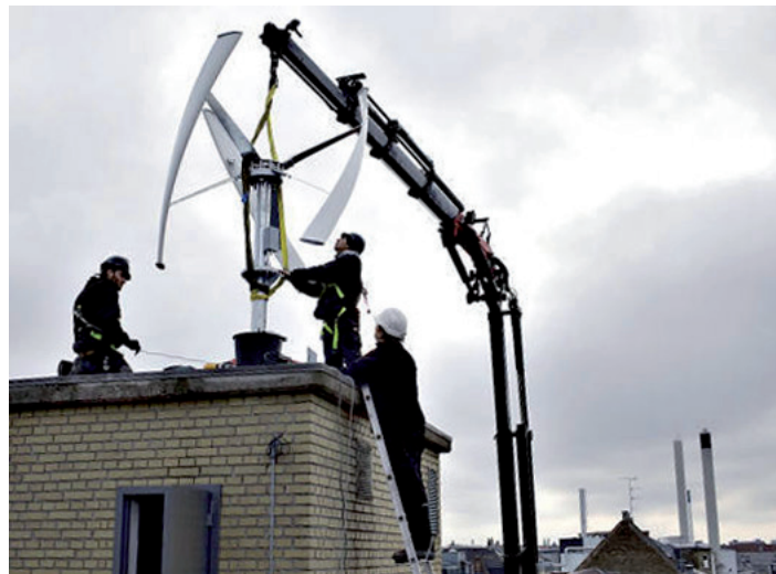
vindmølle under opsætning på taget af Svanevej/Ørnevej, Nørrebro