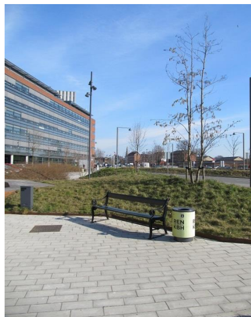
Figur 9 Artillerivej på Amager. Et godt eksempel på mulighederne for at gå op, i stedet for ned i jorden.