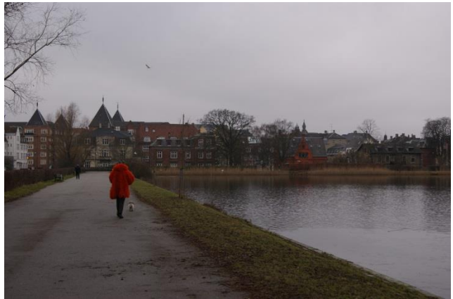
31: Træer plantes i Kampmannsgade i stykket der krydser Sankt Jørgens Sø samt langs den forhøjede gangsti på begge sider af gaden ud mod søen. Begge steder er der i forvejen plantet få træer.