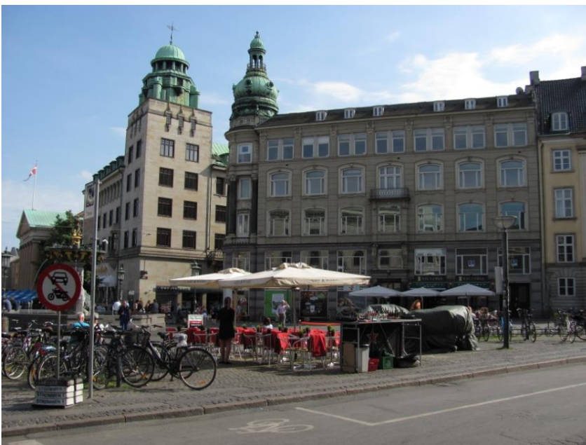
27: Flere træer på Gammel Torv. Cykelstativer kunne placeres rundt om et træ, som det ses gjort med bænke flere steder. Træer plantes så det giver miljø til caféernes udendørs servering.