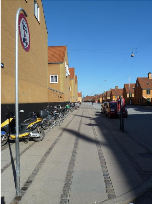
37: Plads til træer på bredt fortov i Kronprinsessegade.