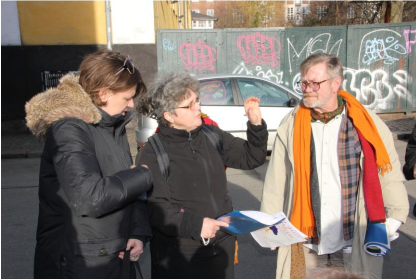
3: Klatreplanter på plankeværk i Bådsmadsstræde for enden af Dronningensgade.