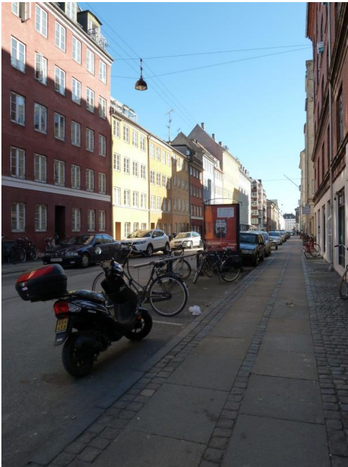
47: Træer plantes hvor nu står gamle stativer fra de tidligere bycykler.