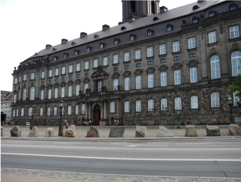
23: Flere træer på Christiansborg Slotsplads.