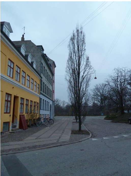
46: Buske plantes imellem de tre Søjle Eg, som allerede står for enden af Suensonsgade i enden mod Rigensgade.