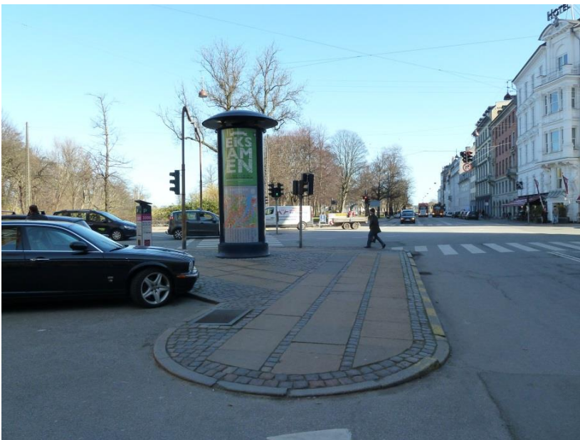
48: Træer plantes på hjørnet af Esplanaden og Bredgade.