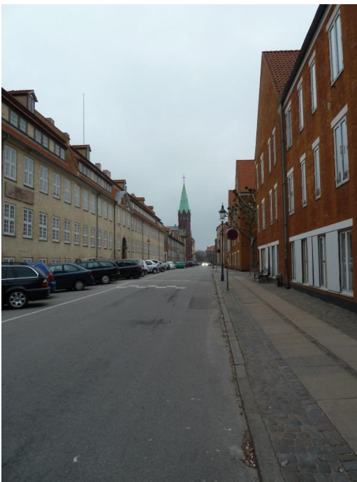
38: Træer og buske i Rigensgade. Borgerne oplyser at ikke mange fodgængere benytter det brede fortov i gaden.