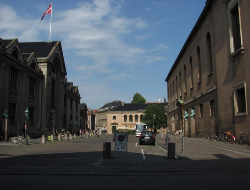
28: Træer plantes langs Vor Frue Kirke i kanten af fortovet ud til Vor Frue Plads.