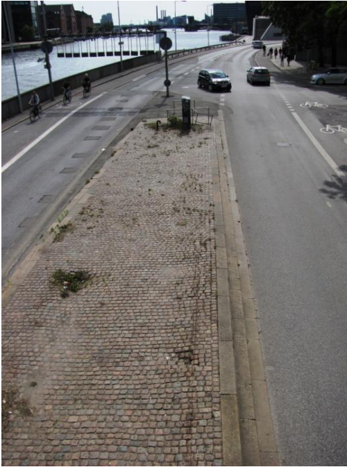
18: Rabatten i midten af Christians Brygge ved Børsen. Kummer a la taget på Industriens Hus ved Tivoli, med beplantning der ikke kræver pasning.