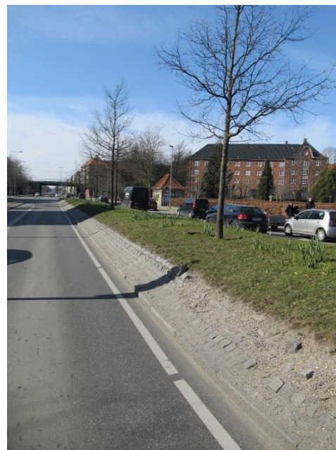
Figur 7 Hævet terræn, her som vejmidte på Roskildevej i Frederiksberg. Her er træerne plantet ca. 1,3 meter over det omgivende terræn.

Hævet terræn kan også bruges på pladser og torve. Her giver de en ekstra dimension til et ellers fladt København. De små bakker, kan medvirke til øget biodiversitet. De vil være et naturligt legested når mor og far holder pause på bænken og vil kunne give læ på blæsende dage.