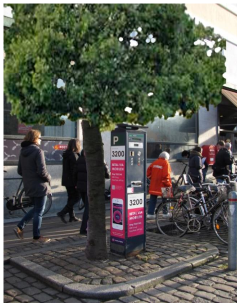
10: Træer på hellerne i Strandgade. For at gøre det mere sikkert for cykler, kunne hellerne gennembrydes med en cykelsti. Der kan sættes træer på de små øer, hvor parkeringsautomaterne står og flytte parkeringsautomaterne op ad muren, som det gøres andre steder i København. Billedet til højre er animeret.