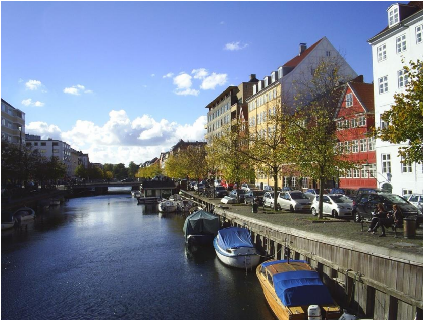
9: Flotte buske mellem de nuværende træer langs kanalen og beplantning i bedene omkring træerne, evt. buske.