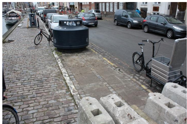
33: Mindre træer plantes langs kajen på begge sider af Nyhavn.