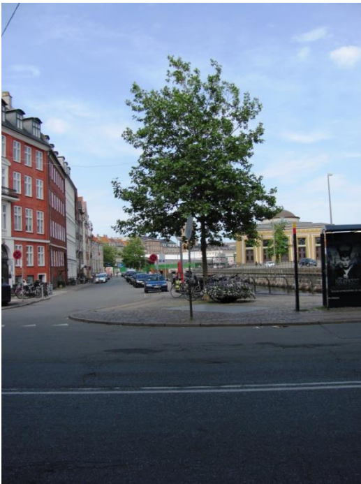
24: Flere træer i Nybrogade langs kanalen.