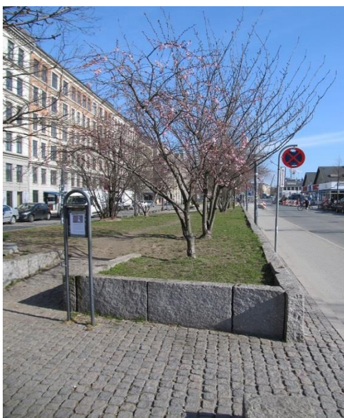
Figur 8 Hævet terræn beplantet med mindre træer. Behovet for at grave under terræn er minimalt her. Træerne er godt beskyttet og ser ud til at trives fint.