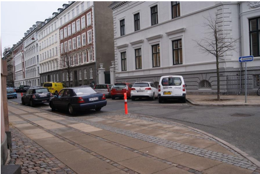
32: Træ plantes på hjørnet af Havnegade og Tordenskjoldsgade. Træ står allerede på modsatte hjørne.