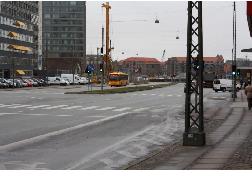
30: Træer og buske plantes i midter-rabatten på Bernstorffsgade evt. i et forhøjet bed så man undgår salt- og kørsels skader.