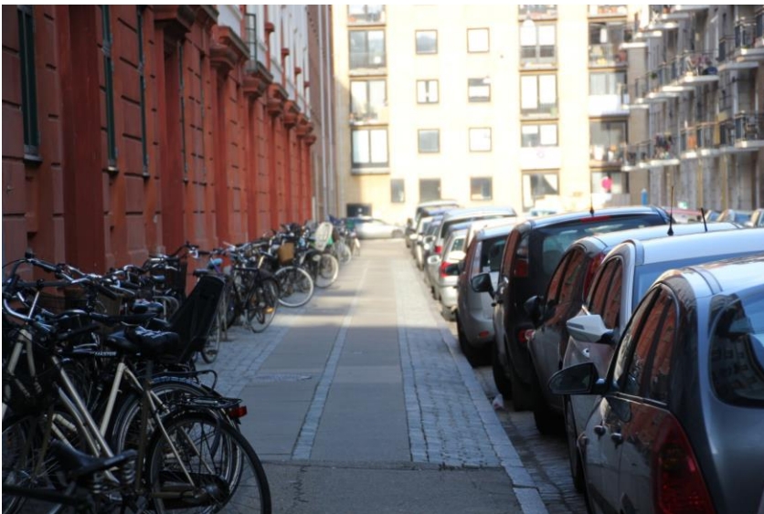
6: Trær i Andreas Bjørns Gade langs det forholdsvis brede fortov. Kunne plantes som træerne i Burmeistergade.