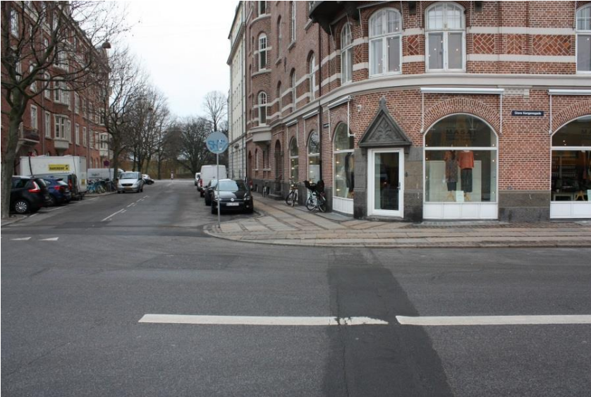
45: Træ plantes på hjørnet af Store Kongensgade og Jens Kofods Gade. Træ står allerede på modsatte hjørne.