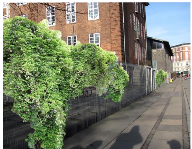
4: Flere steder er der plantet arkitektens trøst op ad hegn i Prinsessegade ind til Christianshavns Skole. Der kunne plantes mere op af hegnet. Beplantes der med stedsegrønne planter, er der grønt hele året. Billedet til højre er animeret.