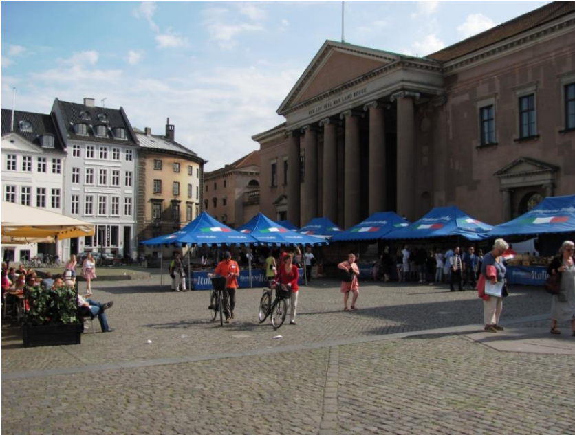
26: Plantning af træer på Nytorv i samspil med caféernes udendørs servering eller ud mod Nørregade.