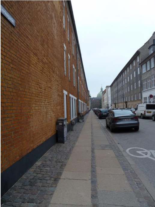
39: Træer langs plejehjemmet Rosengården i Klerkegade.

40: Mere grønt i hundegården på Sankt Pauls Plads. Skal være kvælstof-elskende træer og buske pga. den store mængde efterladenskaber fra hundene.