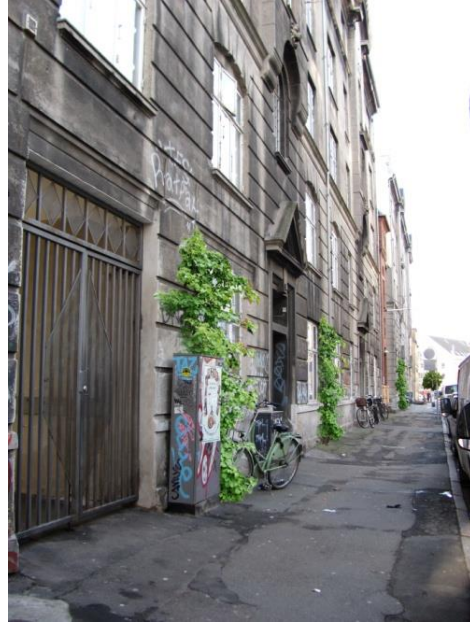
5: Slynplanter op ad husfacaderne i Brobergsgade. Her er et meget tydeligt problem med graffiti, som kan undgås med facadebeplantning. Billedet til højre er animeret.