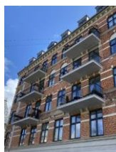
Adresse: Mattheusgade 27 SÅVE-værdi: 5 Bygning opført år: 1880

Det bemærkes, at forslaget betyder, at op mod 12.000 lejligheder ikke kan få altan. At opgøre en bygningens dekoration alene på antallet af dekorationer giver ikke tilstrækkelig mulighed for at imødekomme ønsker om altaner, selvom altanprojektet respekterer facadens udtryk. I stedet bør beslutningen om, hvorvidt der kan monteres altaner på facader med mange dekorationer, træffes ud fra en konkret vurdering, hvor man, via en forhåndsdialog med en sagsbehandler kommer frem til en løsning, der respekterer bygningens oprindelige dekorationer. Der vises to eksempler på eftermonterede altaner på facader med mange dekorationer, som anses som vellykkede: