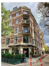
Adresse: Allégade 24 SAVE-værdi: 4 Bygning opført år: 1897

Der er vedlagt to foto af altaner på afskårne gadehjørner, som opfattes som vellykkede.