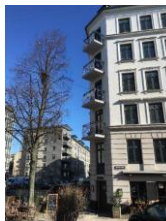
Adresse: Nørremsgade 24 SAVE-værdi: 4 Bygning opført år: 1880