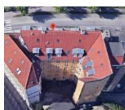
Adresse: Øster Voldgade 14 SAVE-værdi: 3 Bygning opført år: 1852