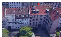
Adresse: Vesterbrogade 134 SAVE-værdi: 5 Bygning opført år: 1854