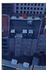
Adresse: Gasværksvej 11 SAVE-værdi: 4 Bygning opført år: 1856

Det foreslås i stedet, at der tillades altaner mod gården efter en konkret helhedsvurdering, hvor der kan tages hensyn til den enkelte bygning. Nedenstående eksempler skal vise, at bygningens alder ikke bør forhindre montage af altaner på gårdfacaden, idet restriktioner i forhold til SAVE-værdien bør være tilstrækkeligt til at sikre bevaringsværdige bygninger.