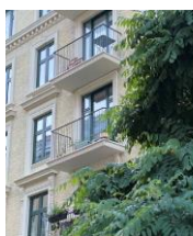
Adresse: Myrundsvej 11 Stokkervej 5 Bygning opført år 1896

Det bemærkes blandt andet, at reglen ikke tillader den nødvendige fleksibilitet og tilpasning til lokale forhold i de enkelte gader. I henhold til forvaltningens egne oplysninger vil forslaget hindre ca. 40 % af alle lejligheder i København i at etablere altaner mod gaden. Det bemærkes desuden, at i de områder af byen, hvor de fleste af bygningerne er fra før 1920, vil forslaget ramme særlig hårdt. To høringsvar fremhæver, at forslaget vil betyde, at op mod 100.000 lejligheder ikke kan få altaner mod gaden, og vedlægger foto af et eksempel på eftermonterede altaner på en bygning fra før 1920, der anses som vellykket.