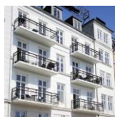
Adresse: Sortedam Dosseng 1 SAVE-værdi: 3 Bygning opført år: 1958