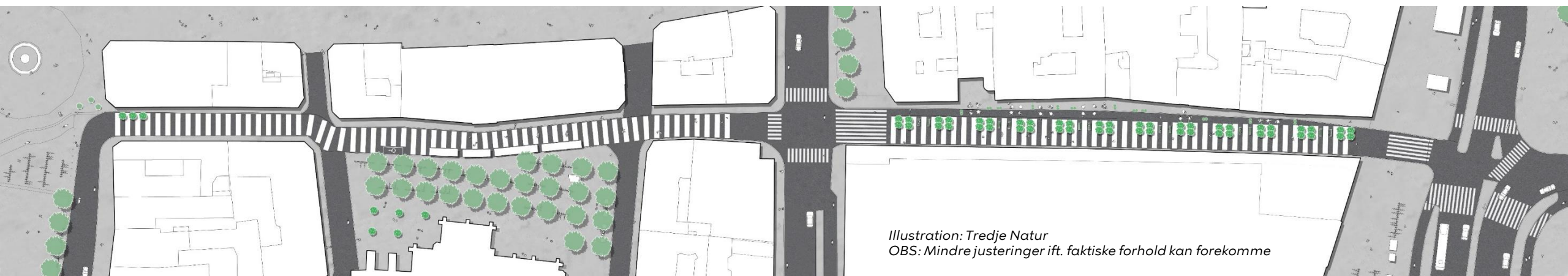
Illustration: Tredje Natur

Der placeres træer og Københavnerbænke på den tidligere vejbane, der opfordrer til rolig færdsel på de bløde trafikanters præmisser. Der males striber på belægningen, som skal signalere fortrinsret for fodgængere.