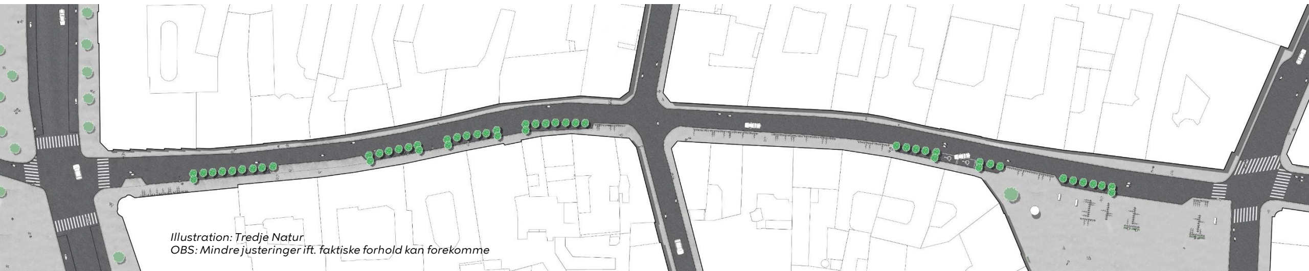
Illustration: Tredje Natur OBS: Mindre justeringer ift. faktiske forhold kan forekomme

Der opsættes træer midlertidigt, der har en adfærdsregulerende, samt lyd- og fartdæmpende effekt. For at forebygge uønsket ophold og støjgener fra nattelivets gæster, etableres der ikke opholdsmuligheder i gaden.