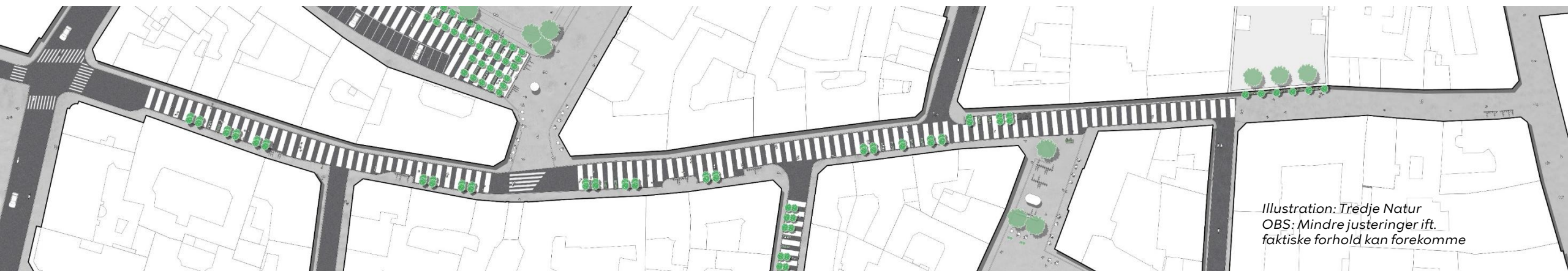
Illustration: Tredje Natur OBS: Mindre justeringer ift. faktiske forhold kan forekomme

Vi håber, at butikker og beboere vil bidrage med initiativer i kantzonerne eller med arrangementer.