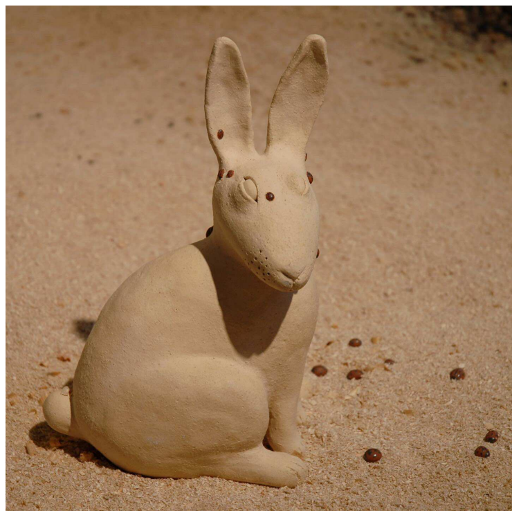
Keramikkaniner til installationen. Produceret på residenciet Materialbaserade processer , Konstnärernas Kollektivverkstad, Bohuslän, Sverige, 2024. Venstre: 40 x 25 x 10 cm, højre: 40 x 30 x 20 cm