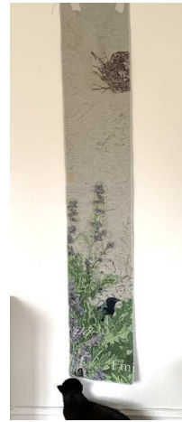
VÆVET BILLEDETÆPPE, RÅSKITSE, DETAJLER, FARVEPRØVER FRA TESTVÆVNING, 200*200 CM