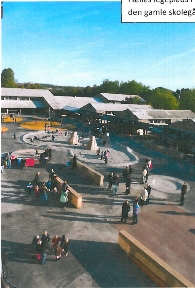
Fælles legeplads i den gamle skolegård