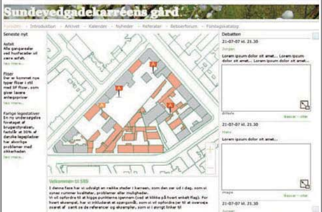
Ex på hjemmeside, her Sundevedsgade-karreem

Gårdrumsspillet vil have til huse på en hjemmeside oprettet specifikt for denne karré. Her kan borgerne få informationer og debattere vedr. anlæggelsen af det nye gårdanlæg. Via et brugervenligt, interaktivt 3d-værktøj har borgerne endvidere mulighed for at komme med forslag til det kommende gårdanlæg samt opleve, hvordan det vil komme til at se ud i 3 dimensioner. På alle tidspunkter i processen kan beboerne debattere egne og andres forslag og synspunkter - med mulighed for bidrag fra eksempelvis landskabsarkitekt og øvrige eksterne parter.