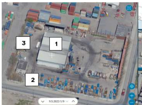
(KK Kort 2023, viser industribygning (1), kontorbygning (2) og et udhus (3))

Kontor- og industribygning er opført i 1991. Udhuset er fra 2008. De tre bygninger er så nye, så de ikke er vurderet ift. bevaringsværdier. I ansøgningen er der ikke oplyst, hvorfor bygningerne ønsket nedrevet eller hvad der ønskes opført. En årsag kan muligvis være, at bygningerne ikke svarer til ansøgers behov for området i dag.