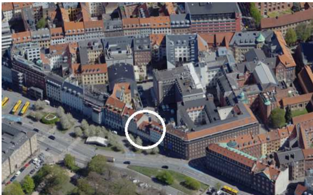
(Nørre Voldgade set fra nordvest og Ørstedsparken)

I området ses punktvis lave byhuse, fx på Teglgårdsstræde og på hjørnet af Teglgårdsstræde og Nørre Voldgade ses også to ejendomme, der kun fremstår i 4 etager.