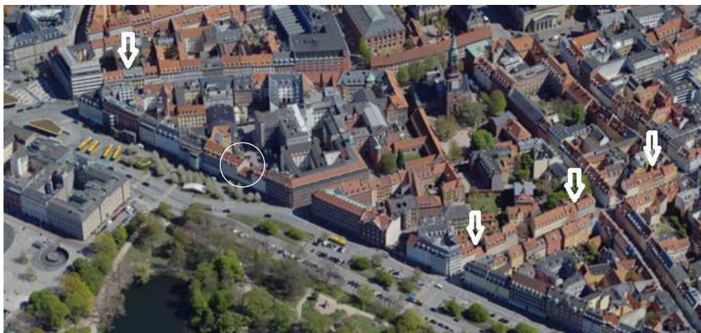
(Pilene markerer eksempler på andre steder i området, hvor der ses lave byhuse)

I området ses punktvis lave byhuse, fx på Teglgårdsstræde og på hjørnet af Teglgårdsstræde og Nørre Voldgade ses også to ejendomme, der kun fremstår i 4 etager.