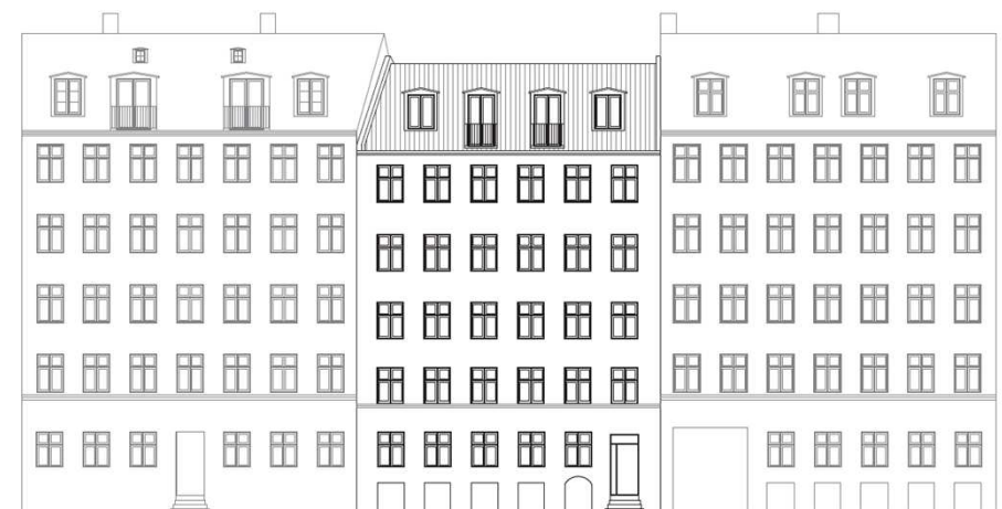
(Facadetegning set fra gaden fra forhåndsdialogmateriale, fremtidige forhold)

Ansøger har på nuværende tidspunkt ikke et konkret projekt, men har i forhåndsdialogen udtrykt ønske om at lave en to-etages tilbygning, som også vil indeholde boliger. Bygningen vil således komme til at være i fem fulde etager (stue og 1.-4. sal) samt udnyttet tagetage. Mod gården ønskes desuden etableret altaner.