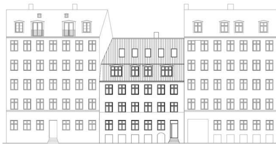
(Billede og facadetegning set fra gaden fra forhåndsdialogmateriale, eksisterende forhold)

Ansøger har på nuværende tidspunkt ikke et konkret projekt, men har i forhåndsdialogen udtrykt ønske om at lave en to-etages tilbygning, som også vil indeholde boliger. Bygningen vil således komme til at være i fem fulde etager (stue og 1.-4. sal) samt udnyttet tagetage. Mod gården ønskes desuden etableret altaner.