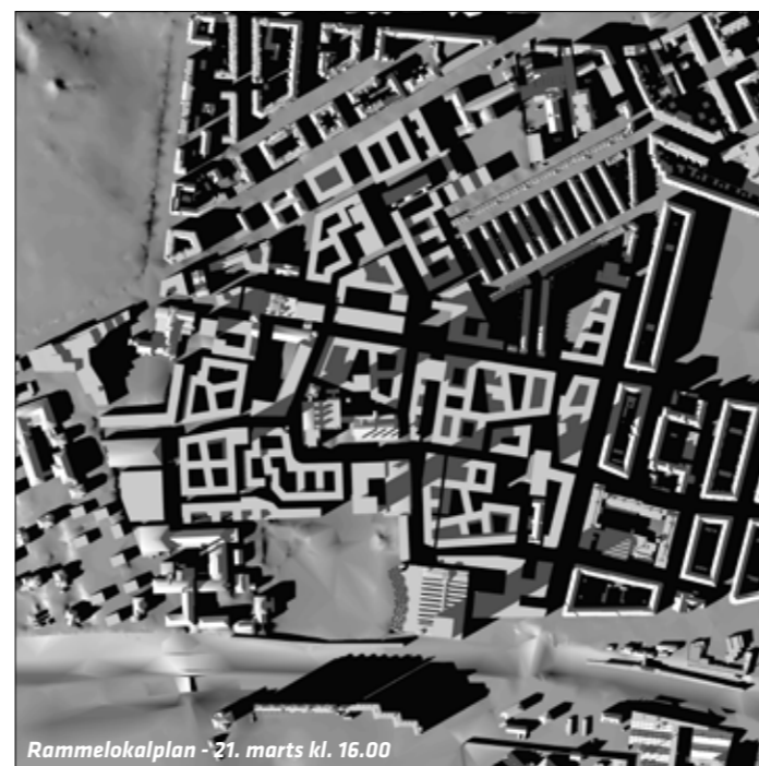
Skyggediagrammerne viser lokalplanens område den 21. marts kl. 12 og 16. Til venstre vises resultatet af lokalplanforslagets placering af højhuse og til højre ses resultatet af den justerede højhusplan. Det kan blandt andet fornemmes, hvordan flytning af højhus nr. 3 giver forbedrede lysforhold i Humleby, og hvordan reduktion af højhus nr. 4 giver bedre lysforhold for naboerne på Vesterbro. På www.kk.dk/lokalplanforslag kan der ses yderligere skyggediagrammer.