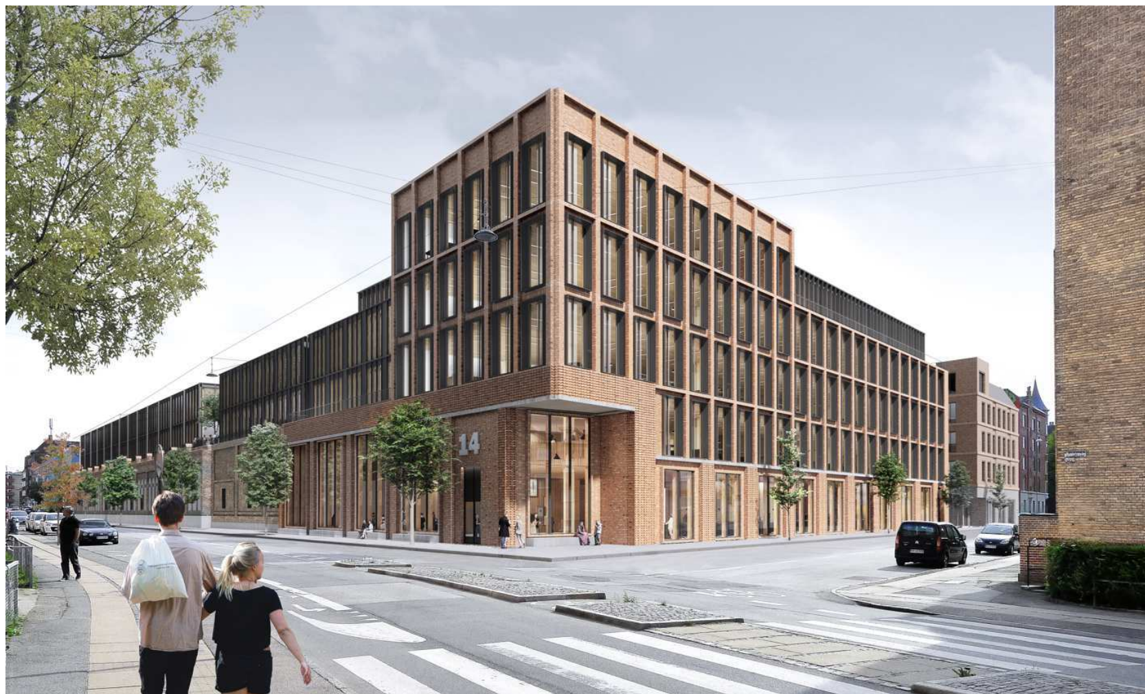
Illustration: Holscher Nordberg Architecture and Planning.