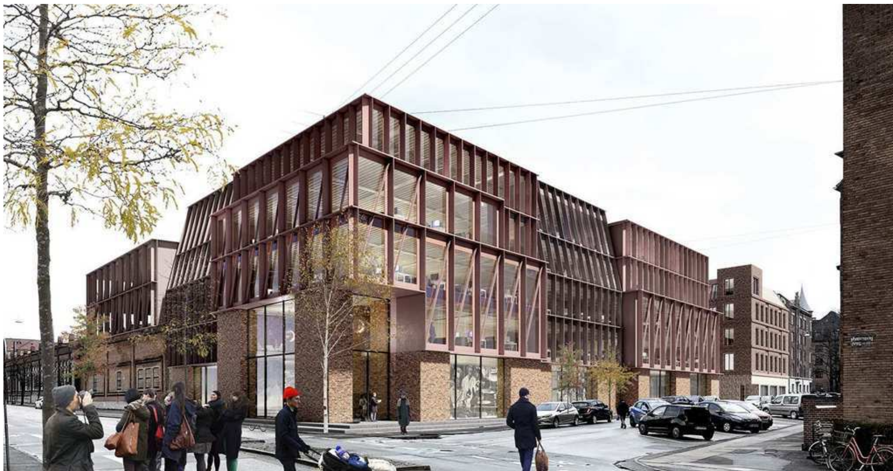
Illustration: Holscher Nordberg Architecture and Planning.