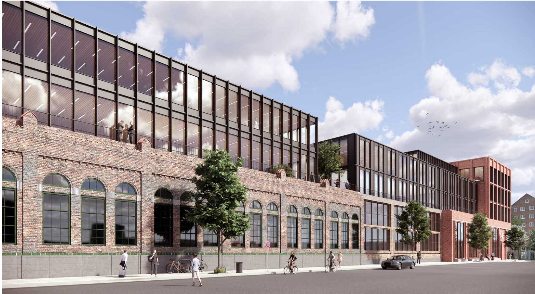
Illustration: Holscher Nordberg Architecture and Planning.