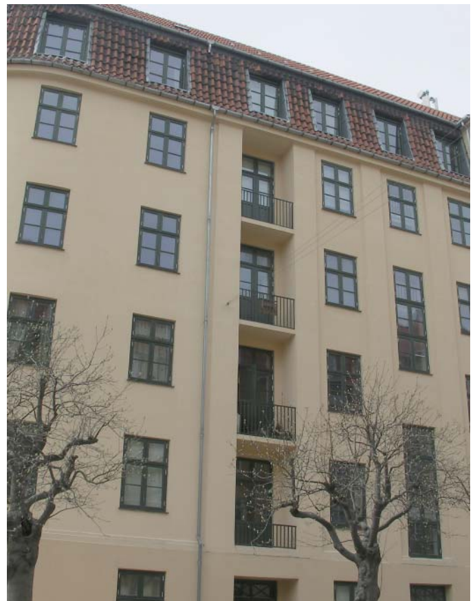
Øverst til højre: Ejendommen set fra hjørnet Norgegade/Finlandsgade