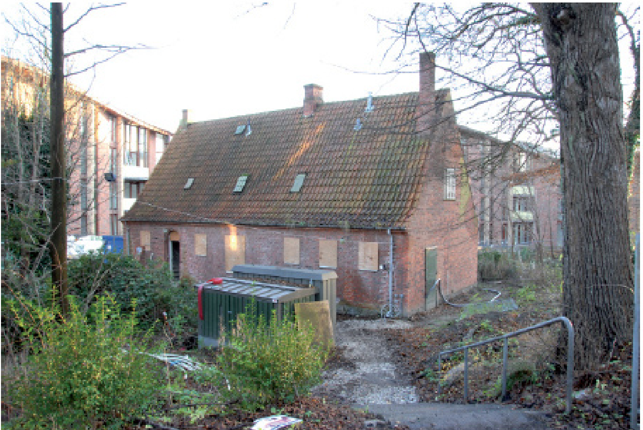
Gartnerboligen set fra vejen