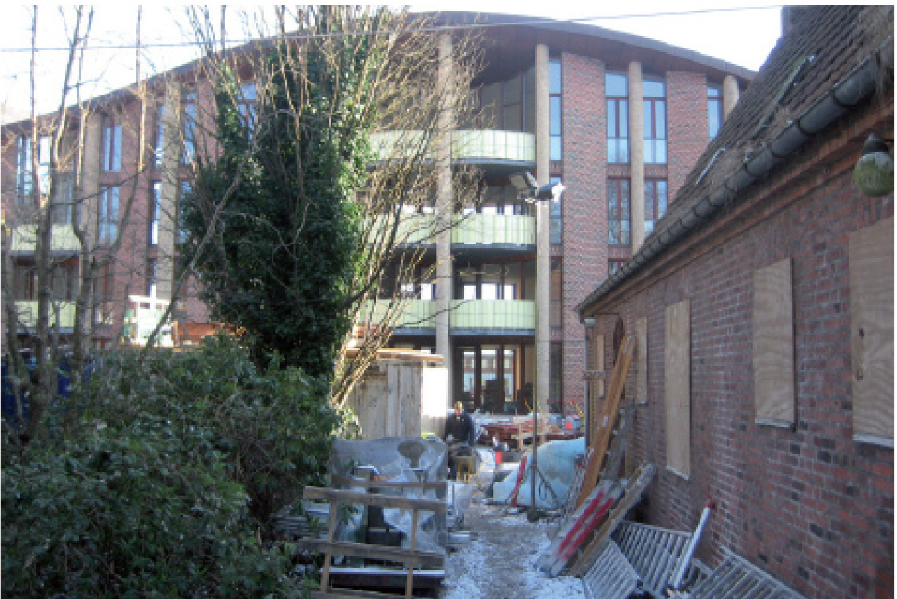
Nærhed til ny bebyggelse