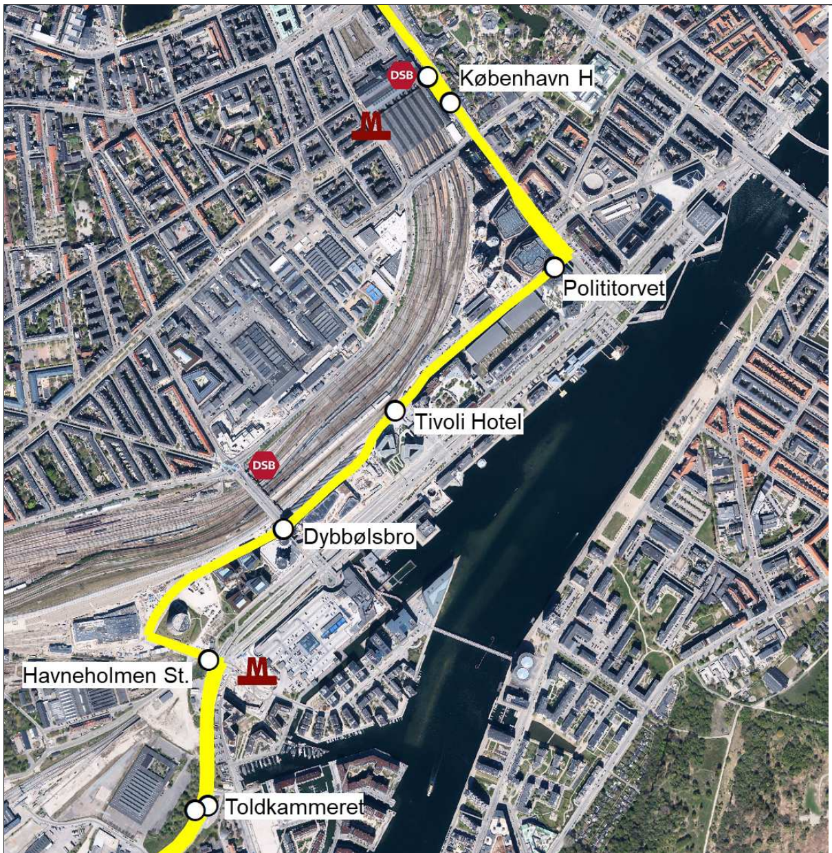
Kortet viser forslag til en ruteføring ad Carsten Niebuhrs Gade for linje 17

Forslaget betyder at linje 17 vil kunne nærbetjene de aktiviteter som findes, og fremkommer, langs Carsten Niebuhrs Gade, herunder Tivoli Hotel, den nye busterminal, Ikea, Kaktustårnene og styrelsernes hovedkontor i nummer 43. Samtidig opnås der forbindelse til den nye metrostation på Havneholmen. Det vil dog også betyde at forbindelsen til Fisketorvet bliver lidt længere, men shoppingcenteret vil dog opnå god betjening med den nye metrostation.