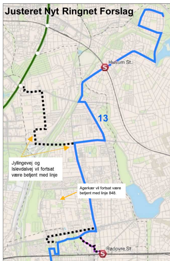
Justeret Nyt Ringnet forslag hvor linje 13 kører til Tingbjerg