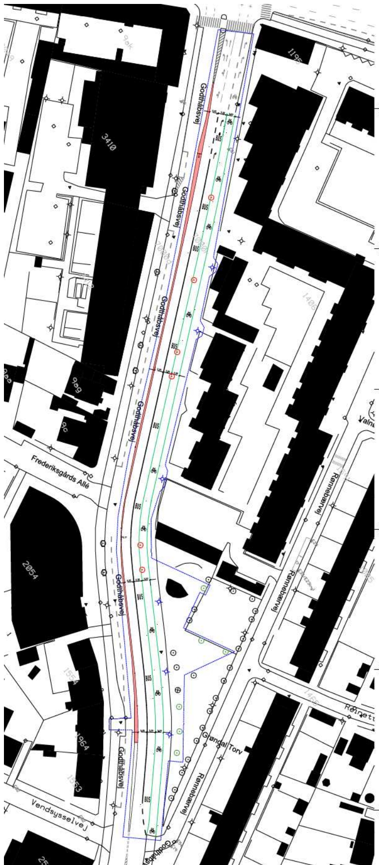
Etablering af 270 m busbane på Godthåbsvej. Oversigt