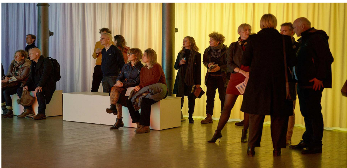
fra Nanna Debois Buhl, Stellar Spectra 2020