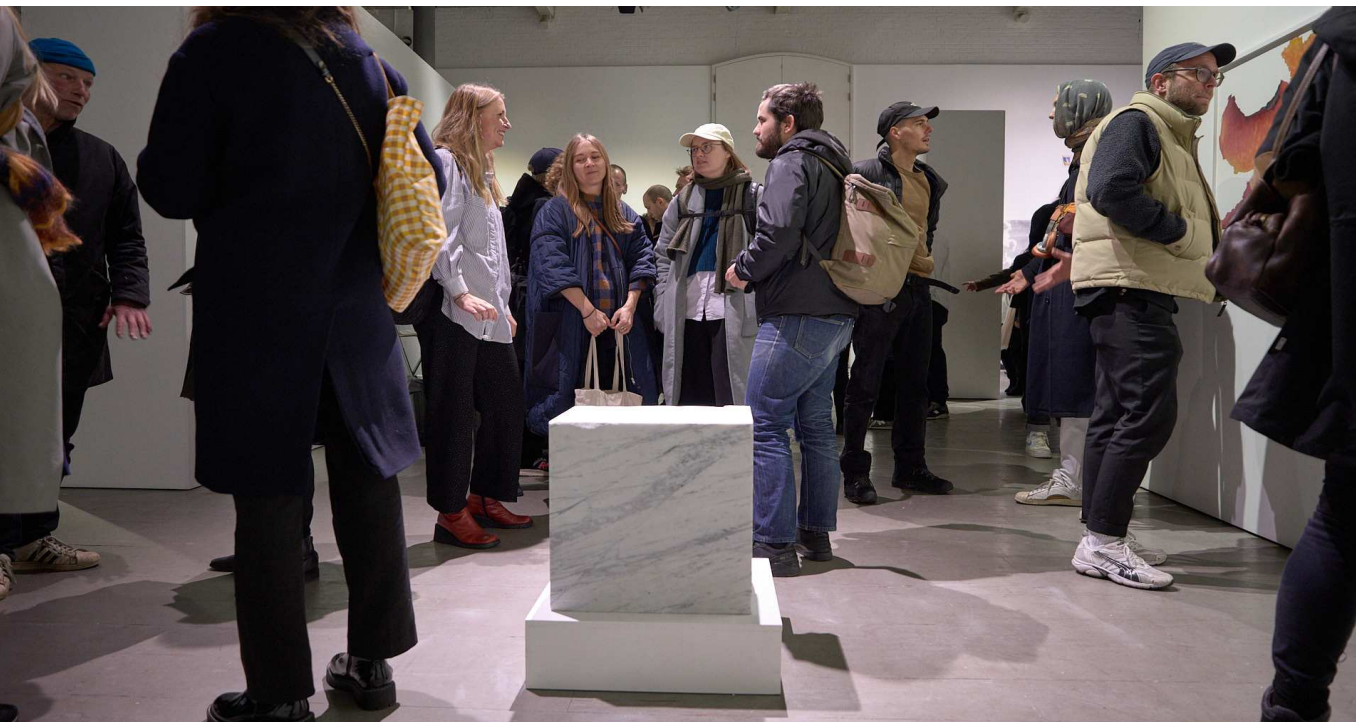
© Troels Jeppe/Fotografisk Center, fra Ung dansk fotografi 2019

På vores hjemmeside kan man læse mere om tidligere samt kommende udstillinger, opleve vores online udstillingsplatform 'ON THE GO' og læse om alle de andre tilbud, vi faciliterer hos Fotografisk Center.