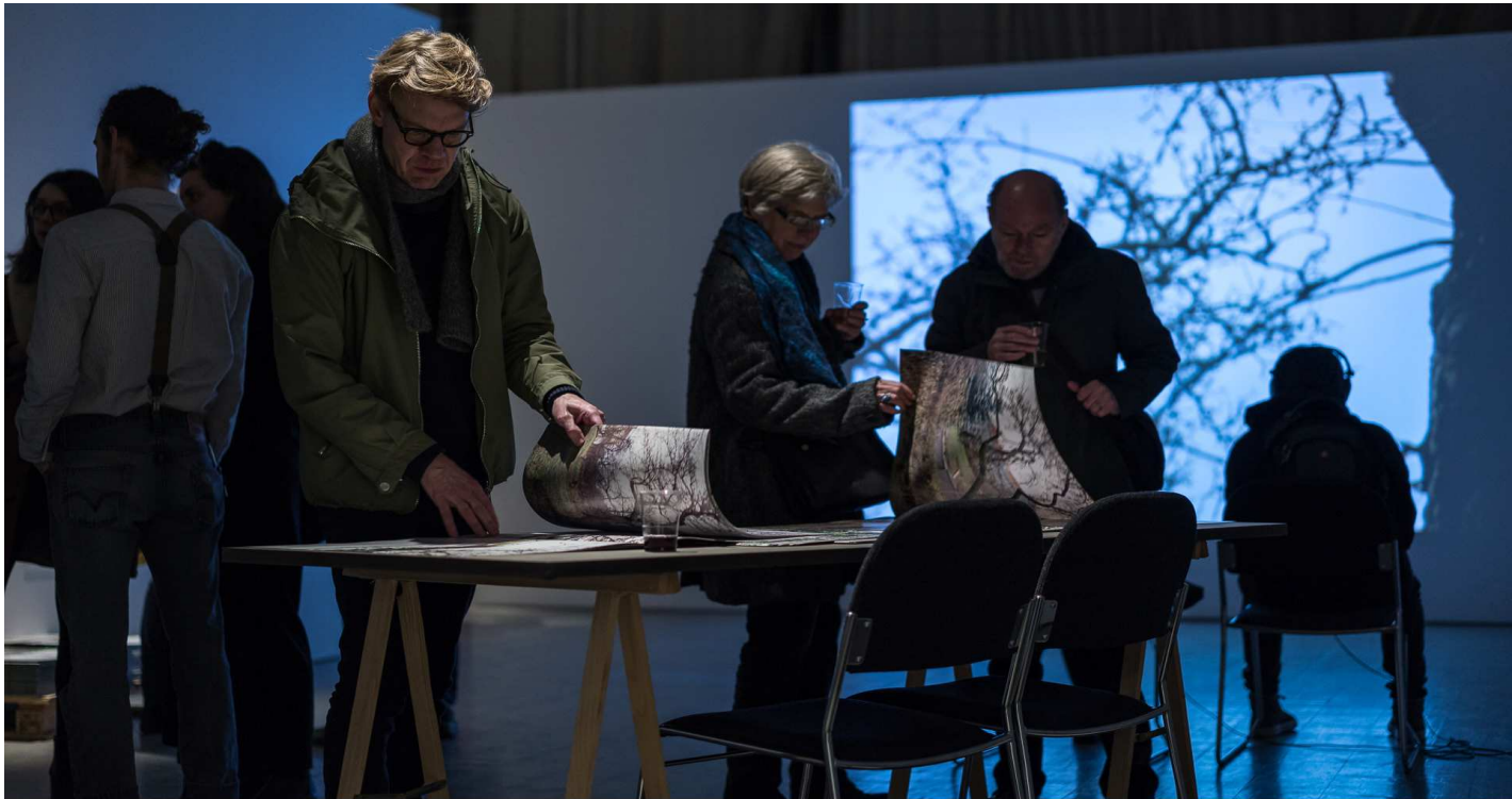
fra Marte Aas: Space Grammar 2018

Vi vil gerne gøre mere af det, vi allerede er gode til – og gøre det endnu bedre.