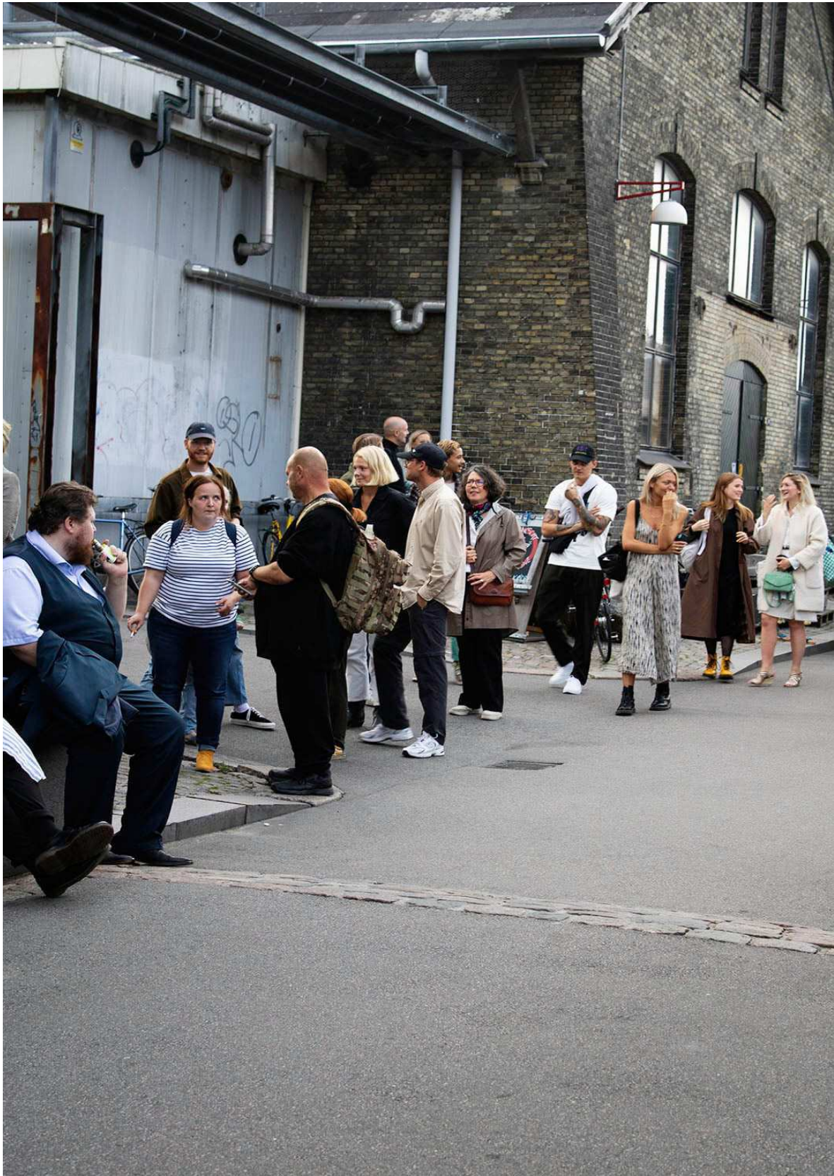
kø til Ung dansk fotografi 2020