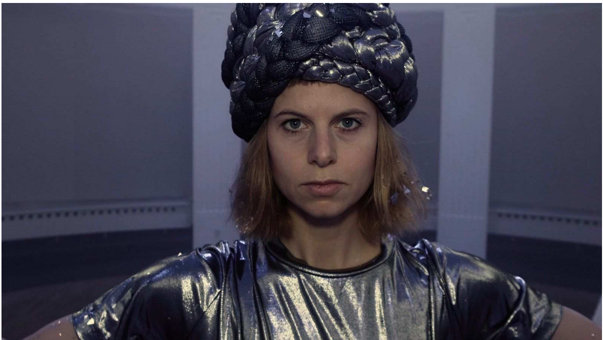
Foto: DEN BLÅ TIME af Schmidt & Lundtoft. Screenshot: Peer Jon Ørsted, 2020.