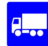
Anbefalede rute for lastbiler - eksempel fra Strandvænget