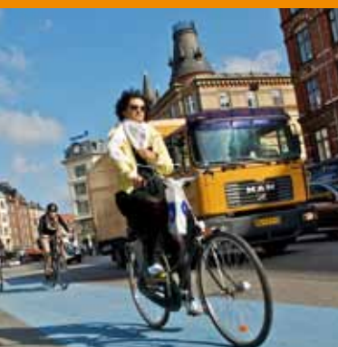
Det anbefalede rutenet for lastbiler - fuldt implementeret

— Rødt rutenet - anbefalet rute for lastbiler - - - Nordhavnsvej