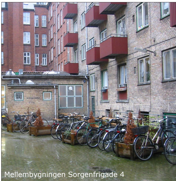
Mellemlbygningen Sorgenfrigade 4

Byfornyelsesområdet omfatter ejendommene Stefansgade 1-3, Nørrebrogade 183-189, samt Sorgenfrigade 2-10, Søllerødgade 40-42, alle beliggende 2200 København N.