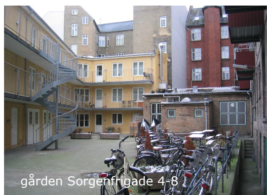
gården Sorgenfrigade 4-8