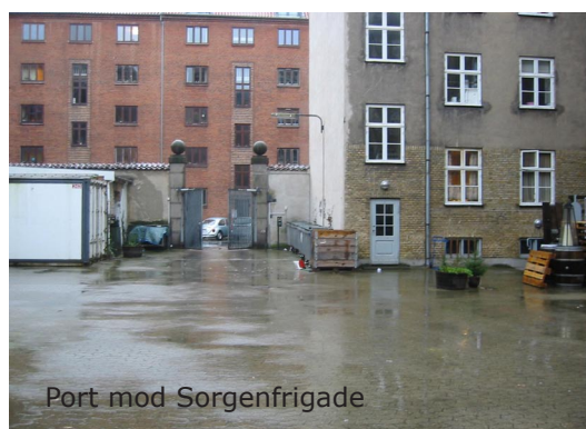
Port mod Sorgenfrigade

En vinhandler i Sorgenfrigade 40 har ligeledes erhvervskørsel i gården med større og mindre