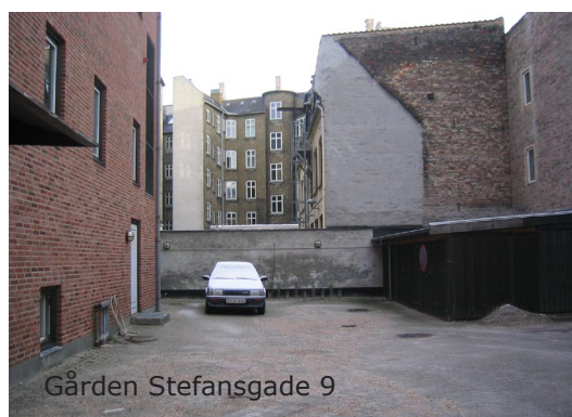
Gården Stefansgade 9