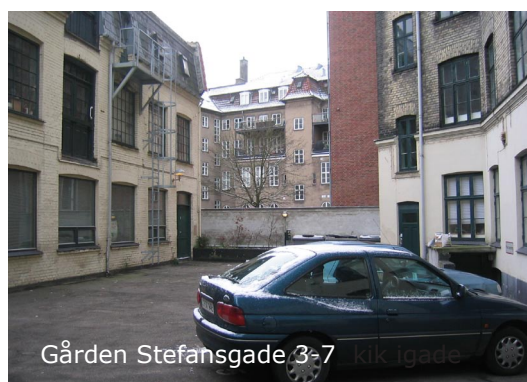
Gården Stefansgade 3-7 kikkigade