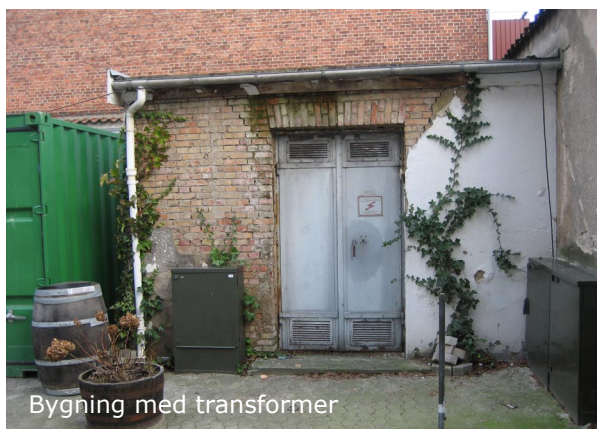
Bygning med transformere

Umiddelbart i tilknytning til porten i Sorgenfrigade er beliggende en muret bygning, der rummer en transformator. Bygningen er udtjent, og trænger til istandsættelse.