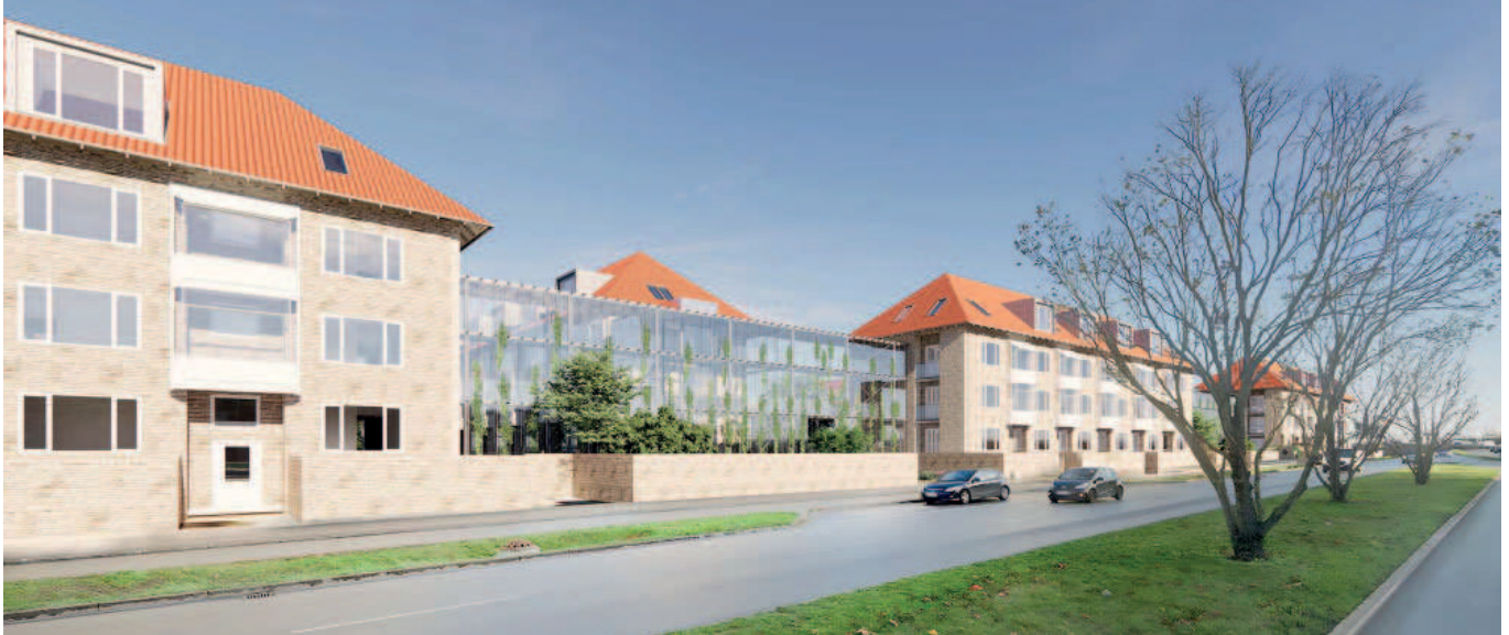
Illustration af støj-orangeri mellem blokke mod Folehaven, med glasfacader og adgangssystem for tilgængelighedsboliger