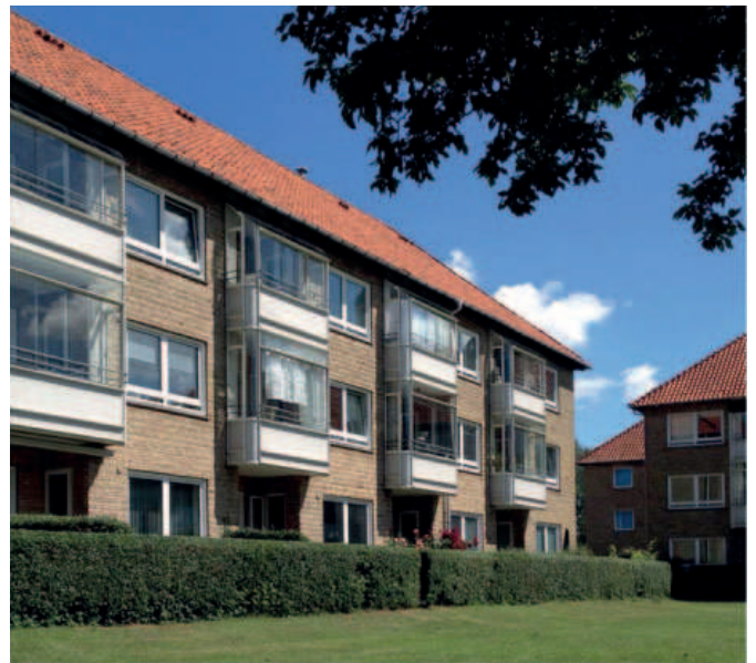
Facader mod et af Elleparkens gårdrum.

Kortudsniit, hvor Elleparken er markeret med rød farve. Øvrige almene bebyggelser i området er markeret med stiplede linje.