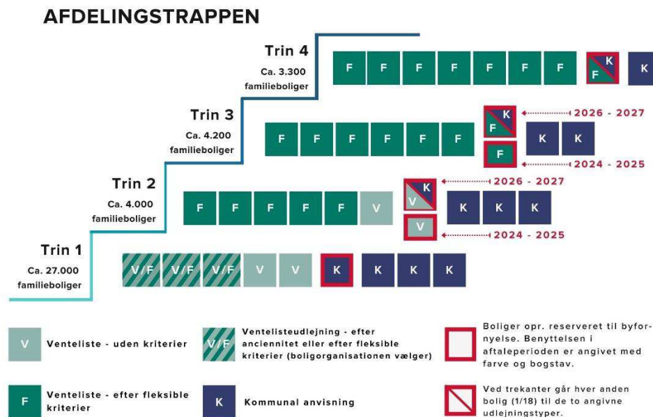
Figur 3: Afdelingstrappen

Det er et bærende princip i udlejningsaftalen, at der ikke løbende kan ske boligsocial anvisning til mere end hver tredje ledige bolig i en afdeling. Til gengæld skal modellen medvirke til, at kommunen får adgang til at anviser til flere betalbare boliger i de øvrige afdelinger, der bedre kan bære det. Modellen sikrer, at boligafdelinger, der aktuelt bærer en stor andel af den boligsociale anvisning, skærmes, mens andre boligafdelinger i højere grad bringes i spil, dels via almindelig boligsocial anvisning, dels via oprettelsen af boliger med huslejetilskud.