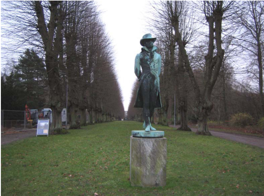
Norske Allé i dag - set fra midten af hovedaksen og statuen af Oehlenschläger