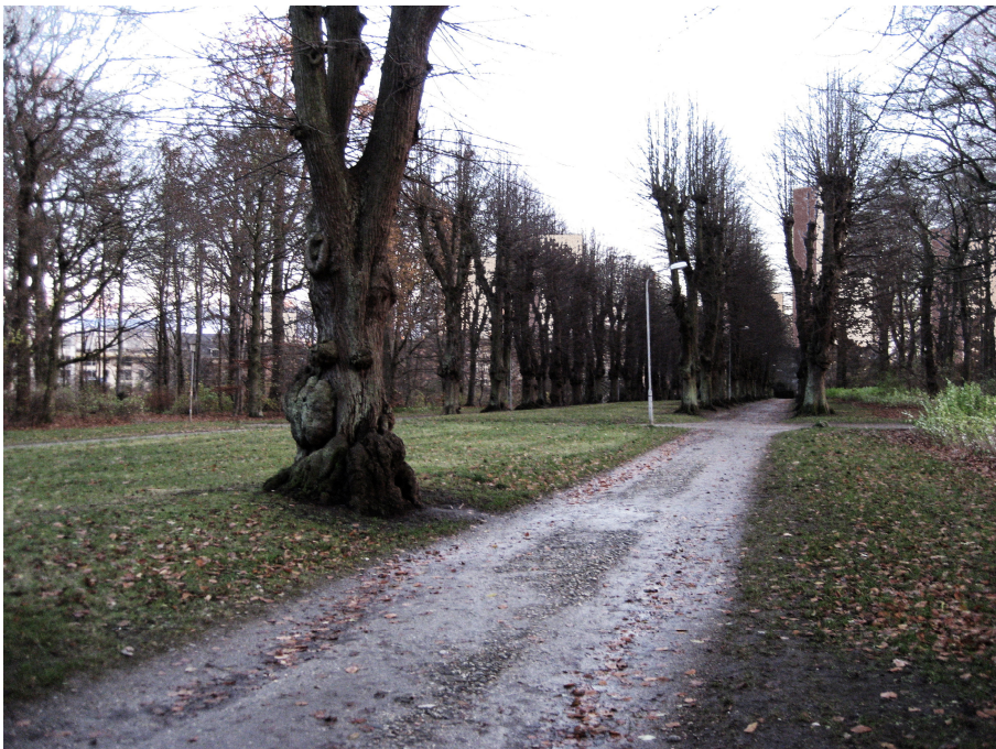
Norske Allé - visualisering set fra stisystemet - her træder højhuse i baggrunden og skjules delvist bag træerne