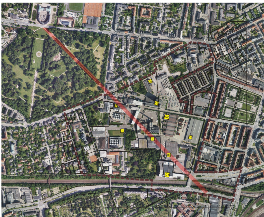
Luftfoto af området med markering af de 9 planlagte højhuse på Carlsberg samt forlængelsen af Søndermarkens hovedakse Norske Allé