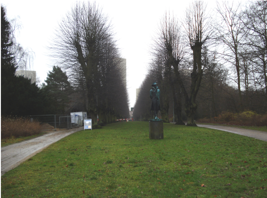
Norske Allé - visualisering set fra venstre side af hovedaksen mod Carlsberg - her anes højhusene bag træerne, mens sigtelinjen er friholdt