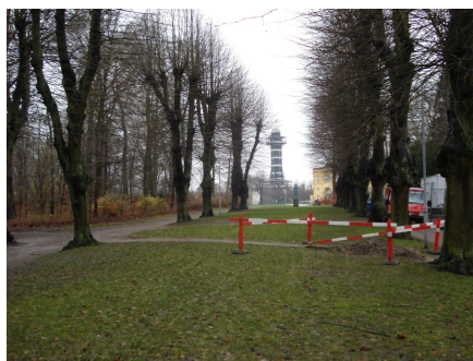
Norske Allé i dag - set mod henholdsvis syd (tv) og mod nord (th)