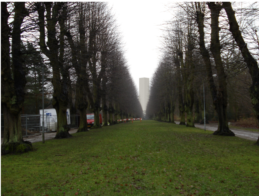
Norske Allé - visualisering set fra midten af hovedaksen mod Carlsberg og med højhus 03 markant midt i sigtelinjen