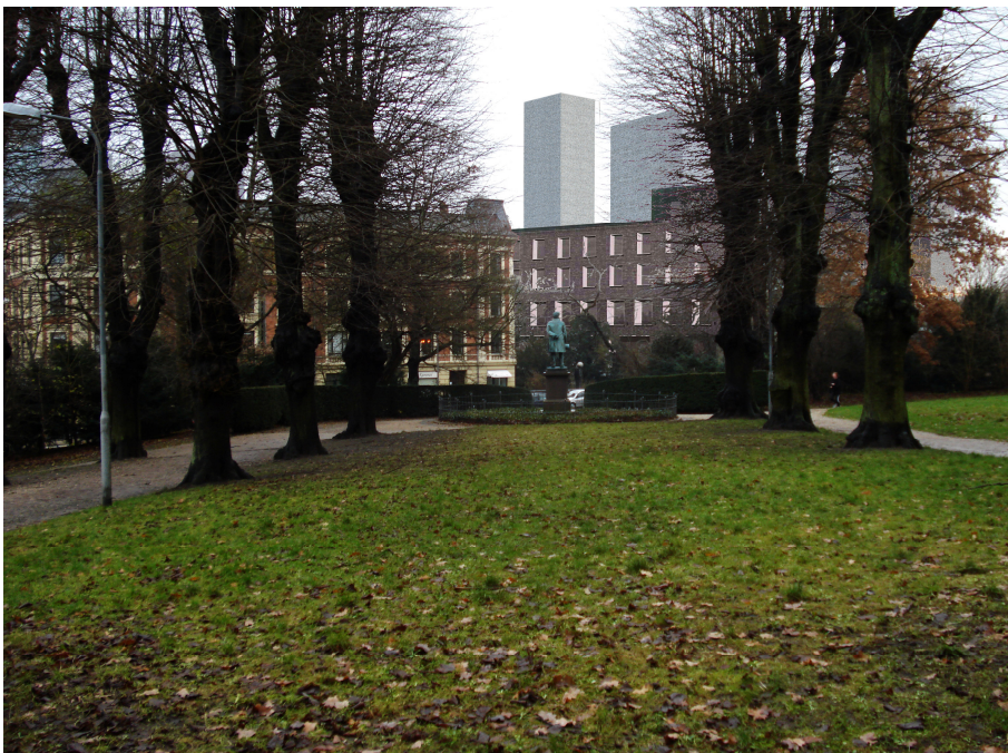
Norske Allé - visualisering af den supplerende høring set fra midten fra Norske Allé helt nede ved Pile Allé - i midten ses højhus 03 og til højre højhus 08.

Alle visualiseringer er udarbejdet af Entasis