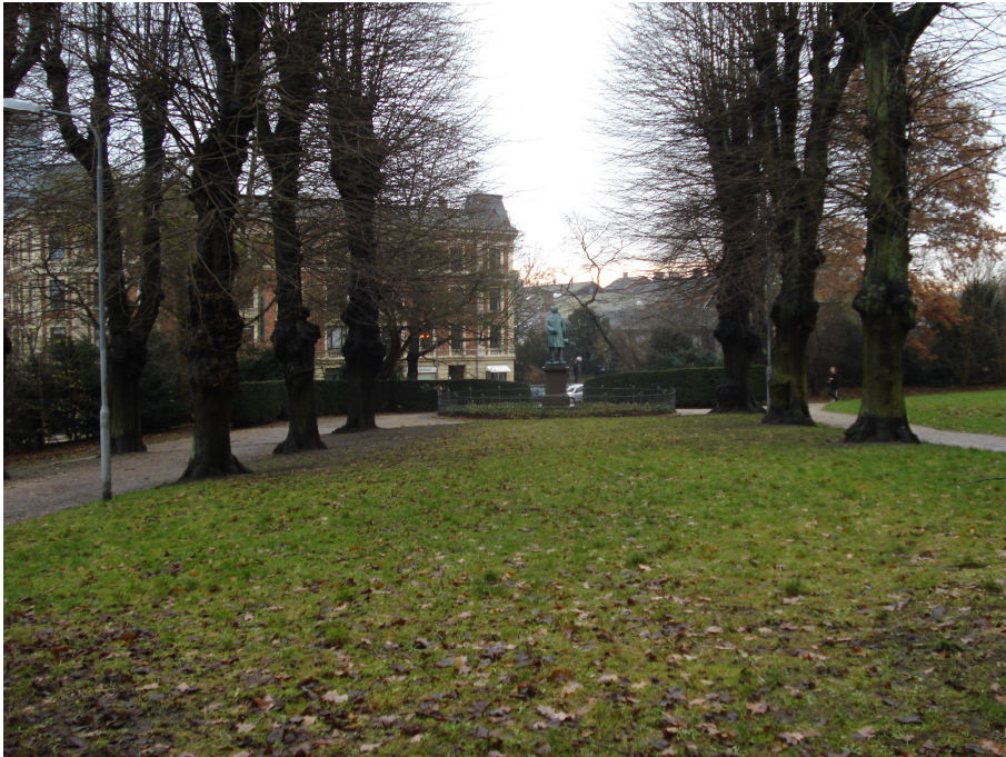
Norske Allé i dag - set fra midten af hovedaksen helt nede ved Pile Allé