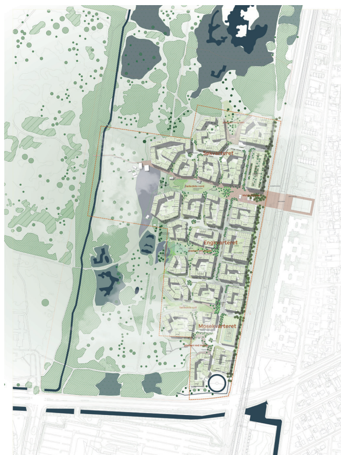
Illustration fra masterplanen (tegnestuen Vandkunsten og Marianne Levinsen Landskab)

Der vil blive vejadgang til området fra Ørestads Boulevard. Området vil blive struktureret, så biler og tung trafik hovedsageligt holdes i bykvarterets østlige del. Det er også langs Ørestads Boulevard det er planlagt at placere parkeringshusene. Bebyggelsens stifterbindelser vil blive koblet til det eksisterende stinet på fælleden og de omkringliggende veje til gavn for cyklister og fodgængere.