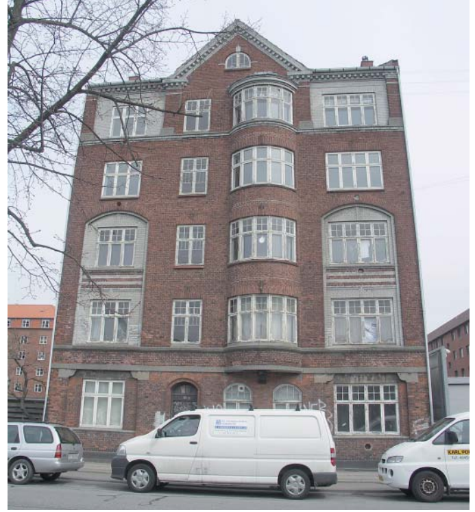
Øverst til højre: Ejendommens facade set fra Sundholmsvej