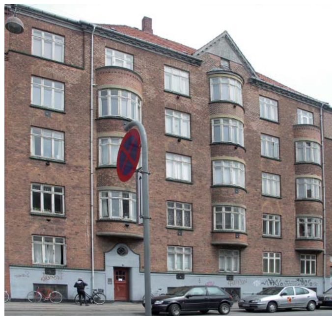
Øverst til højre: Ejendommen set fra hjørnet Kurlandsgade/Sundholmsvej