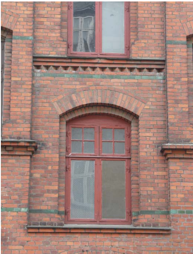
Nederst til høje: Ejendommens facade set fra sydvest