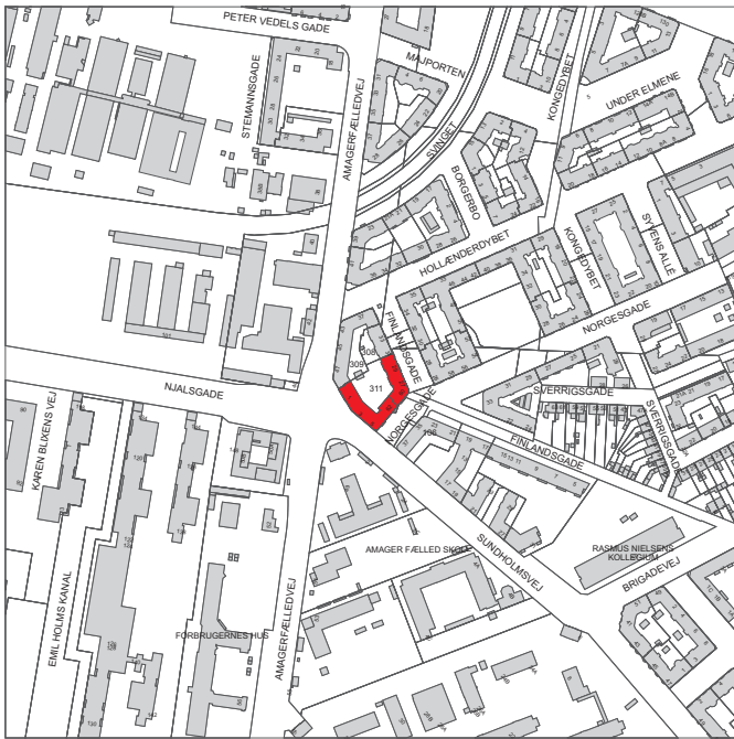
Ejendommen ligger i bydelen Amager Vest