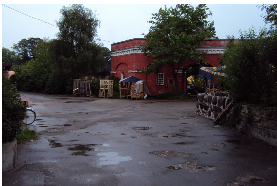
Krydset Langgaden / Mælkebøtten

Rutens mange knæk samt hastighedsdæmpende foranstaltninger skal sikre, at der ikke opnås høj hastighed for cyklister gennem området. Ruten er således et grønt og mere trafikikkert alternativ til de få trafikerede veje, der i dag forbinder bydelene.