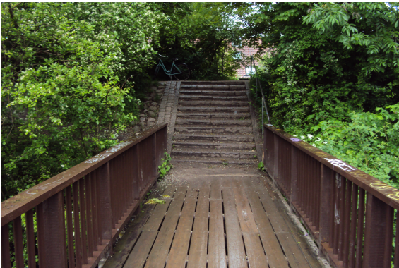
Linieføring Kommuneplan -volden set fra sydsiden

Kommuneplanens linieføring går via en nuværende sti, der krydser hen over det fredede voldanlæg. Der er således ikke noget gennembrud i volden på dette sted, hvilket medfører, at man i dag skal stå af cyklen for at forcere volden, hvilket giver meget ringe tilgængelighed. Kulturarvsstyrelsen har over for forvaltningen afvist et voldgennembrud.