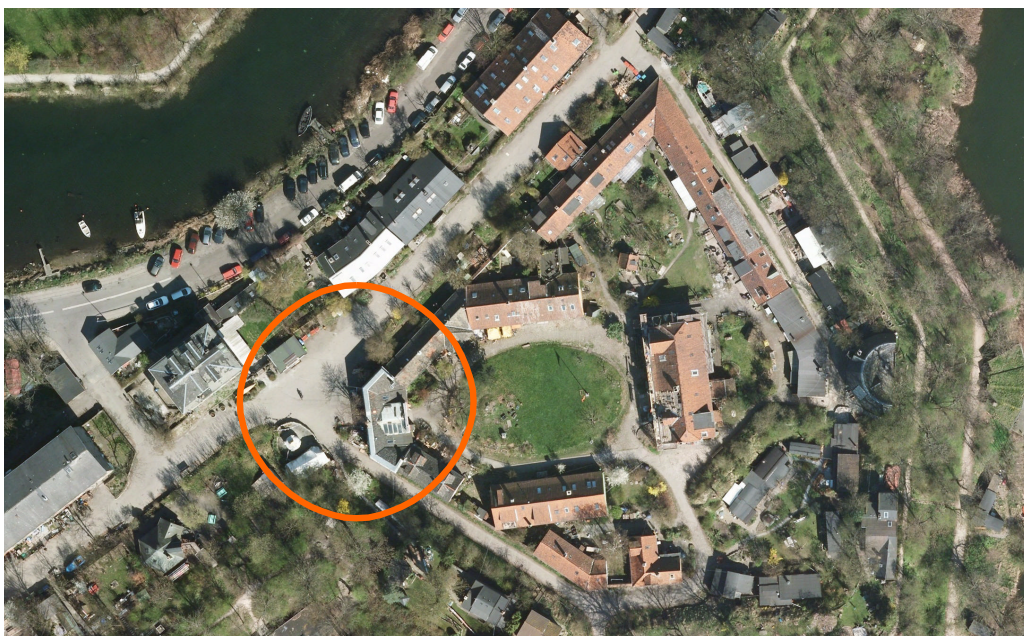
Luftfoto - krydset ud for indgangen til Mælkebøtten er markeret