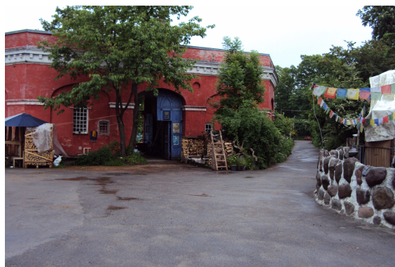
Indgangen til Mælkebøtten og stien til Dyssebroen