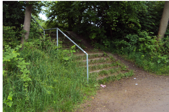
Linieføring Kommuneplan -volden set fra nordsiden

Forvaltningens anbefalede forslag til linieføring udnytter et eksisterende gennembrud i volden og vurderes i mindre grad at genere Christianias beboere langs Dysestien. Den nye placering af krydsningen af Kløvermarksvej er desuden placeret, hvor der er bedre oversigtsforhold for cyklister og gående, der skal krydse den tungt trafikerede Kløvermarksvej.