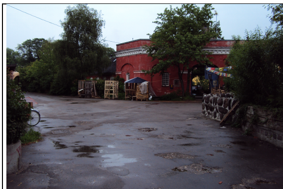
Krydset Langgaden / Mælkebøtten

Rutens mange knæk samt hastighedsdæmpende foranstaltninger skal sikre, at der ikke opnås høj hastighed for cyklister gennem området. Ruten er således et grønt og mere trafiksikkert alternativ til de få trafikerede veje, der i dag forbinder bydelene.