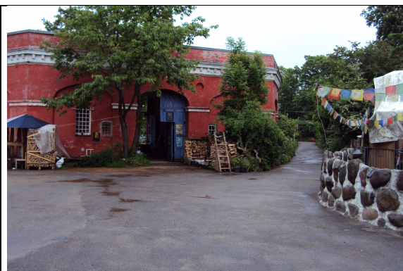
Indgangen til Mælkebøtten og stien til Dyssebroen