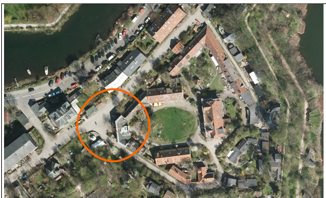
Luftfoto - krydset ud for indgangen til Mælkebøtten er markeret