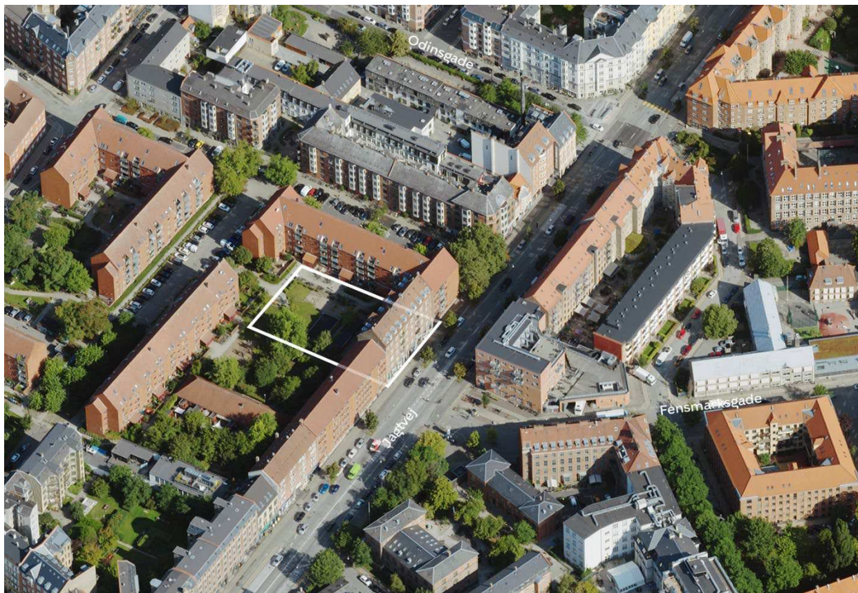
Området set mod retning, for eksempel nord. Lokalplanområdet er indtegnet med hvid linje, og de vigtigste gader er navngivet.

fællesareal og forhindre etablering af parkeringspladser på terræn. Anvendelse ændres ikke, og området fortættes ikke yderligere.