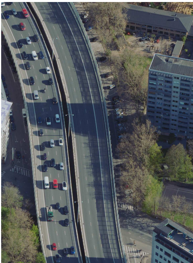
Skråfoto af Bispeengbuen.