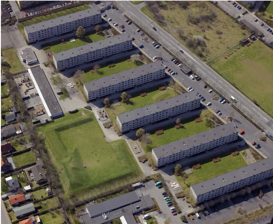
Luftfoto/skråbillede af bebyggelsen, de 6 blokke set fra øst