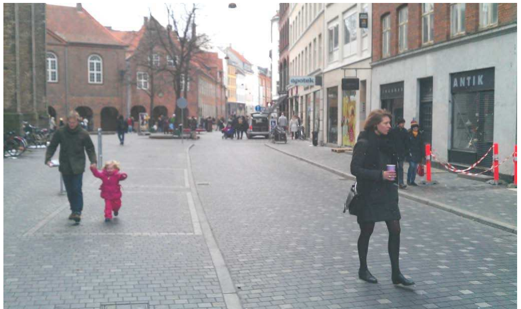
Referencéfoto fra Landemærket, der er udformet efter de samme principper som foreslået anvendt på Sankt Annæ Plads.

Der arbejdes med let sænkede enkeltrettede kørespor med en bredde på ca. 3,25 m, hvilket vil medføre at bilister oftest vil blive bag cyklisterne, men med mulighed for at en cyklist eller en bilist kan passere den anden part, hvis denne er standset op, eller færdes meget langsomt.