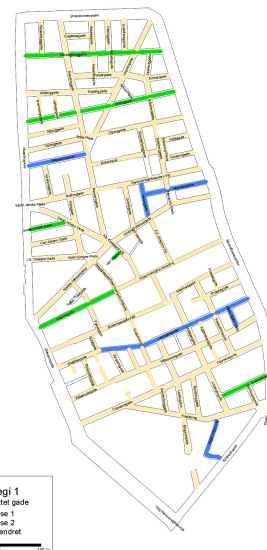
Figur 1: Gader med mere parkering – dobbeltretning, strategi 1

Strategi 1 og strategi 2 er yderligere koblet med hhv. dobbeltretning og ensretning af gaderne.