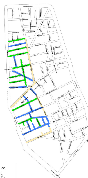
Strategi 3A Fase 1 Fase 2 Uændret