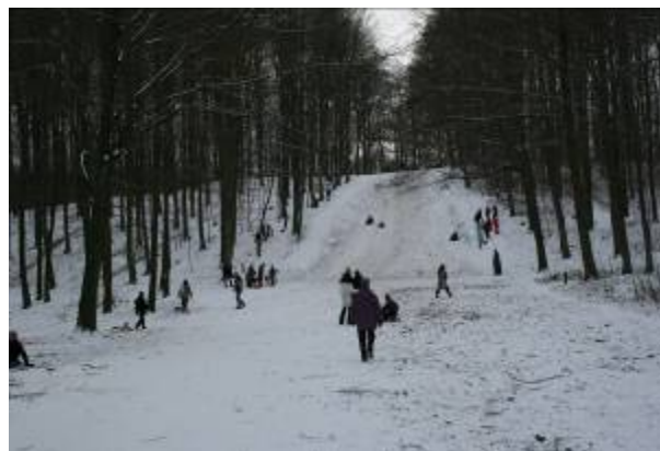
Kælkebakken Højnæsbjerg i Aldershvile Skov. Kælkebakkens historie går tilbage til 1915