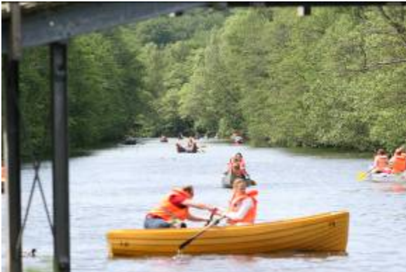
Stor aktivitet i Fæstningskanalen ved Nybro bådudlejning.