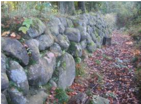
Holmskjolds stendige i Aldershvile Skov