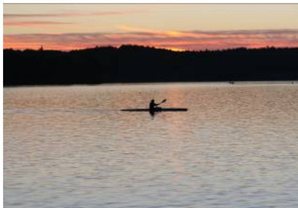
Kajak roer nyder afstemning på Bagsværd Sø

"Naturskøn, fredelig sejlads på søerne lige nord for København - ad Fæstningskanalen over Lyngby Sø til Nybro Kro og videre ud på Bagsværd Sø, hvor der lægges til ved Sophienholm, Bagsværdvej, Aldershvile og Regatta Pavillonen. Herfra returneres til Sophienholm, Nybro Kro og Lyngby." Således er der at læse i en nutidig reklame for Bådfarten. Da bådfarten i 1976 blev overtaget af kommunerne omkring Furesøen, Lyngby Sø og Bagsværd Sø, havde den allerede sejlet på søerne i over 80 år og var blevet en institution, som ingen ville undvære. Bådfartens popularitet hos Storkøbenhavns befolkning og hos hovedstadens turister fremgår af, at den - bortset fra Københavns Havnerundfart og selskabet "Hjejlen" på Silkeborg-søerne - er den største af sin slags i Danmark. Bådfarten har i dag seks motorbåde, hvoraf de fire besejler Lyngby Sø, Bagsværd Sø og Mølleåen, og de resterende to både besejler Furesøen og Vejlesø. Der sejles i sæsonen fra maj til september i fast rutefart på de fire ruter. De to ældste af bådene "Prinsesse Alexandrine" og "Prins Christian" er bygget i henholdsvis 1895 og 1896 og har således været med fra starten. De har sejlet med damp, benzin, gasgenerator og nu med diesel.