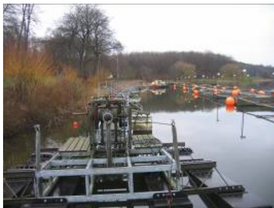
Udstyr ved Bagsværd roklubberne i Regattaområdet med tilskuer pladserne i baggrunden.

Danmarks Naturfredningsforening tog på den baggrund i 2006 initiativ til et samarbejde med de tre involverede kommuner, Gladsaxe, Lyngby-Taarbæk og Værløse (nu Furesø) om udarbejdelse af dette fredningsforslag. Samarbejdet har resulteret i, at alle tre kommuner er positive overfor en fredning, men at Furesø Kommune og Lyngby-Taarbæk Kommune indtil videre overvejer at være medrejser på fredningssagen, mens Gladsaxe Kommune på enkelte punkter er uenig i fredningsforslaget. Det er baggrunden for at ingen af kommunerne indtil videre har ønsket at være medrejser på fredningssagen. Undervejs har DN holdt adskillige møder med de tre kommuner, hvorunder også en repræsentant fra Danmarks Idræts-Forbund har deltaget, således at deres synspunkter er sagsrejser bekendt.