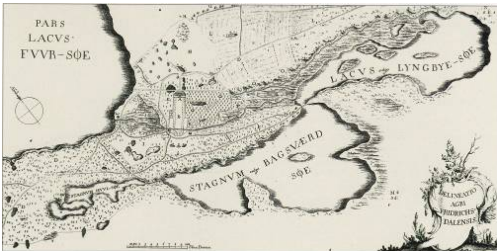
Tegning af Frederiksdals omgivelser fra Müllers værk Flora Frødrichsdalina 1767.

Kobberdammene i Bøndernes Hegn er gamle tørvegrave, som leverede tørv til såvel Aldershvile som til borgerne i København fra ejendommen Højgård. De tre søer ligger på linie smukt "gemt" i Aldershvile Skov i området ved foden af Højnæsbjerg nær Bagsværd Sø.