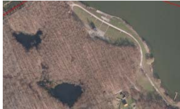
Tilskuerområdet i målområdet og Kobberdammene.

Ved Kobberdammene er der bl.a. fundet en række padder og krybdyr, herunder spidssnudet frø og stor vandsalamander, som er på EF-habitatdirektivets bilag IV. Området karakteriseres som værende af regional værdi. Området karakteriseres i Gladsaxe Kommunes rapport "Vandområder i Gladsaxe Kommune 2007", som havende stor landskabelig værdi der indgår som et vigtigt vådområde i Hareskoven.