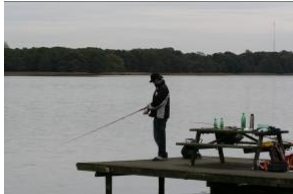
Fiskeri på Aldersvilepynten i Bagsværd Sø.

Udlejning af både foregår bl.a. ved Nybro og Frederiksdal. Udlejningen sker både til lystfiskere, motionister og folk der blot ønsker en stille sejltur på søerne.