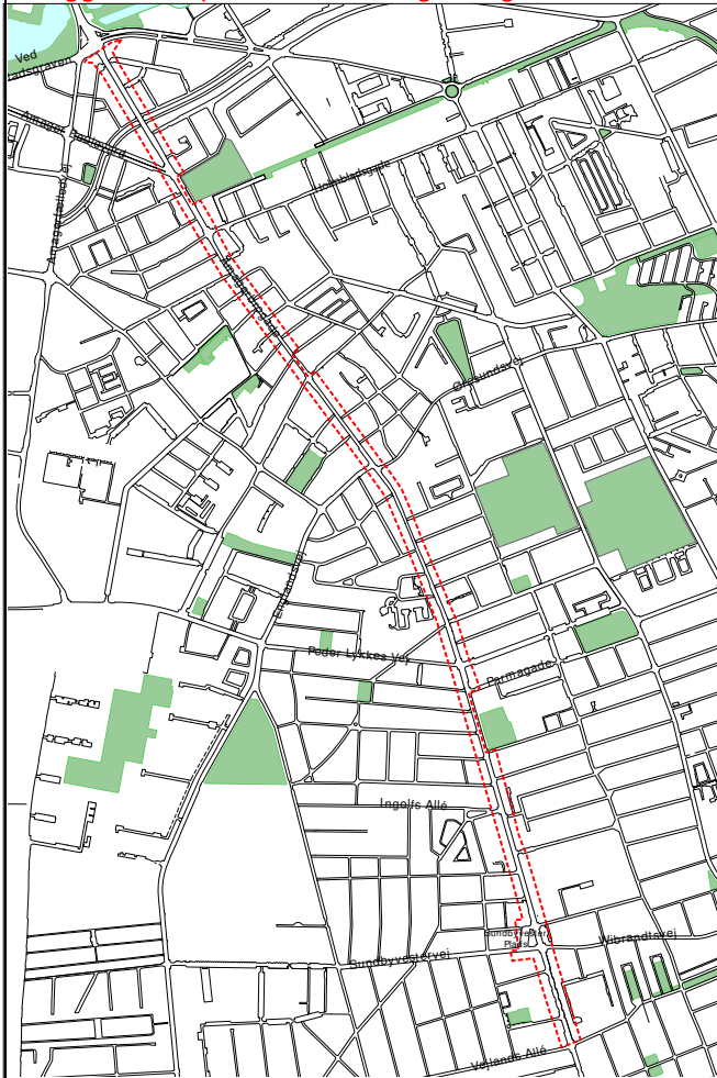
Strøggadelokalplan nr. 158 "Amagerbrogade"