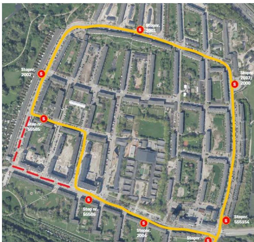
Figur 1: Den gule linje viser den nuværende busbetjening i Tingbjerg med linje 132 og linje 2A. Den røde stiplede linje viser, hvor linje 132's permanente rute kørte, men hvor der i dag ikke er busbetjening pga. anlægsarbejde.