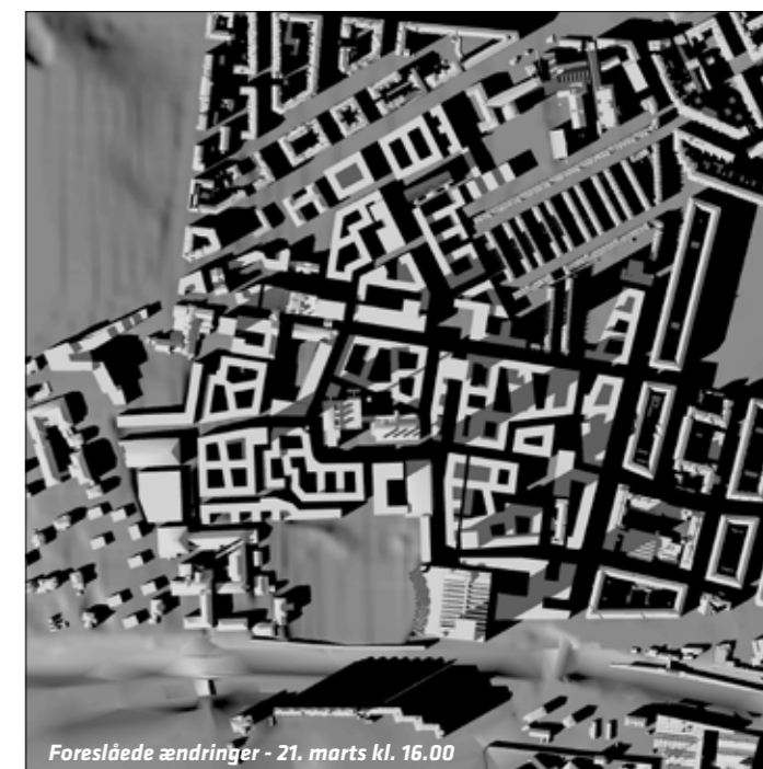
Skyggediagrammerne viser lokalplanens område den 21. marts kl. 12 og 16. Til venstre vises resultatet af lokalplanforslagets placeringer af højhuse og til højre ses resultatet af den justerede højhusplan. Det kan blandt andet fornemmes, hvordan flytning af højhus nr. 3 giver forbedrede lysforhold i Humleby, og hvordan reduktion af højhus nr. 4 giver bedre lysforhold for naboerne på Vesterbro. På www.kk.dk/lokalplanforslag kan der ses yderligere skyggediagrammer.