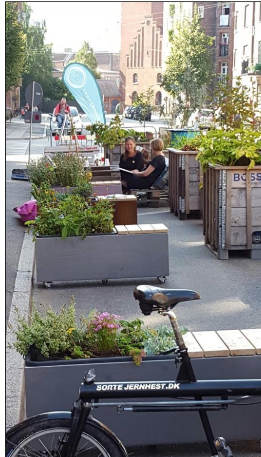
Park(ing) Day.

Isafjordsgade: I samarbejde med initiativet Grønnere Bryggen arrangerede vi en lokal Park(ing) Day på Isafjordsgade. Formålet med arrangementet var at understøtte det lokale arbejde for et grønnere Islands Brygge, som særligt Islands Brygge Lokalråd i en længere periode har haft fokus.