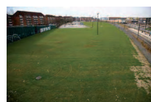
Forslag til placering af kunstgræs-fodboldbane, boldbaner samt klubhus

Den nordlige del af folkeparken med kunstgræsbanen rummer ca. 18.360m 2 af de i alt ca. 48.340m 2 aktivitetspark.