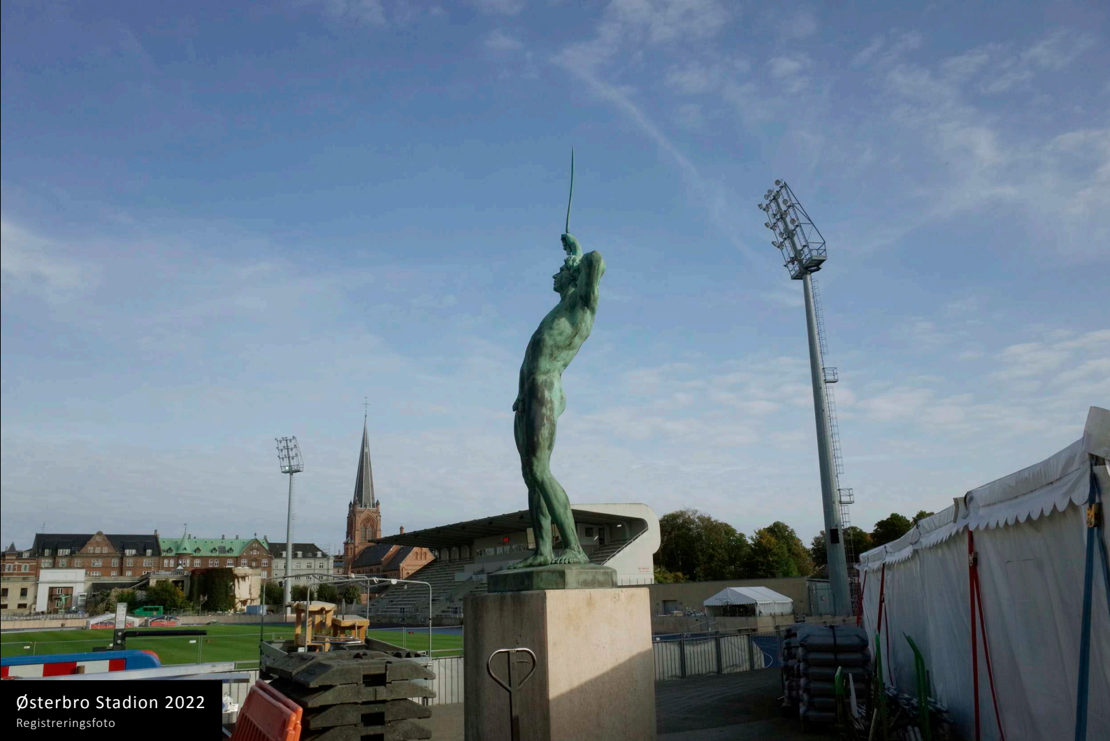
Østerbro Stadion 2022 Registreringsfoto