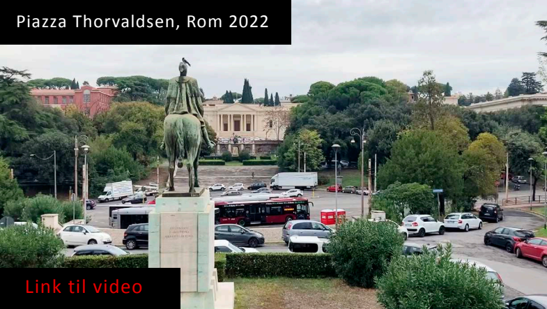
Piazza Thorvaldsen, Rom 2022