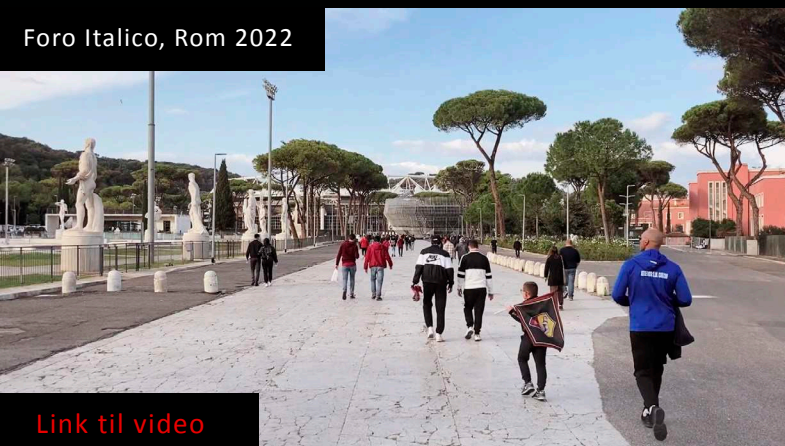
Foro Italico, Rom 2022