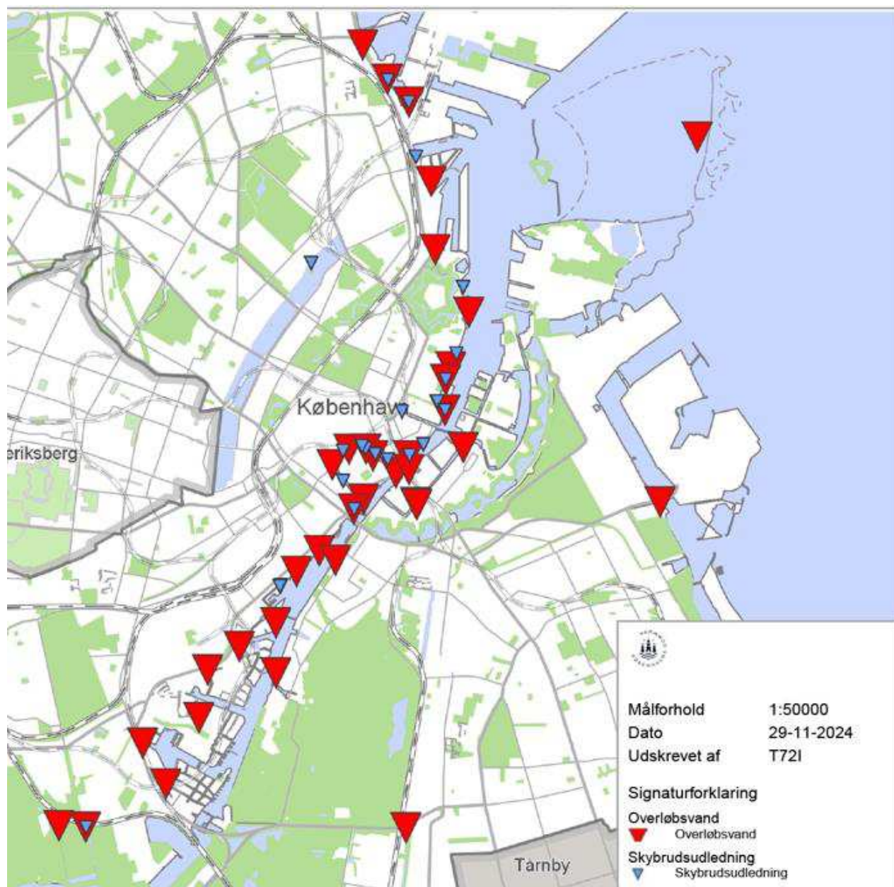
Kort 2: De 51 udledninger med overløb af regnforyndet spildevand og skybrudvand til Københavns Havn