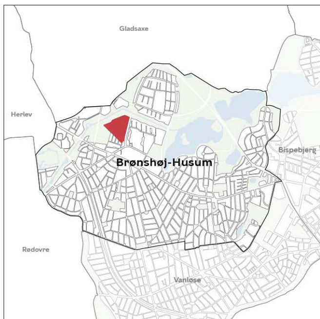
Områdets placering i bydelen.