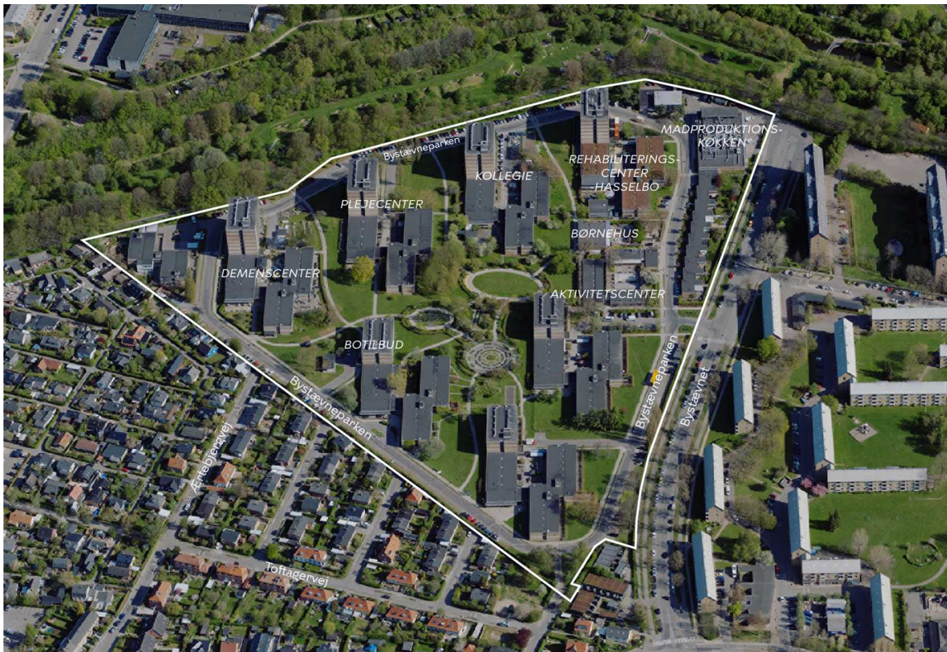
Området set mod nord. Lokalplanområdet er indtegnet med hvid linje, og de vigtigste gader og bygninger er navngivet. Luftfoto: SDFI, 2023.