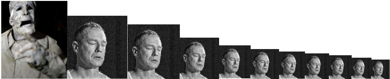
Dukke af Rolf Søborg, Øyvind Kirchoff