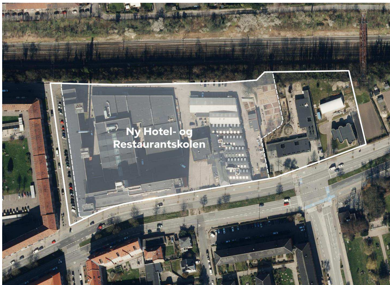
Figur 1 Området som ønskes ændret i det forventede kommuneplantillæg er markeret med en hvid streg. Lokalplanens område, der dækker den ny Hotel- og Restaurant-skolen ses af den stiplede linje.