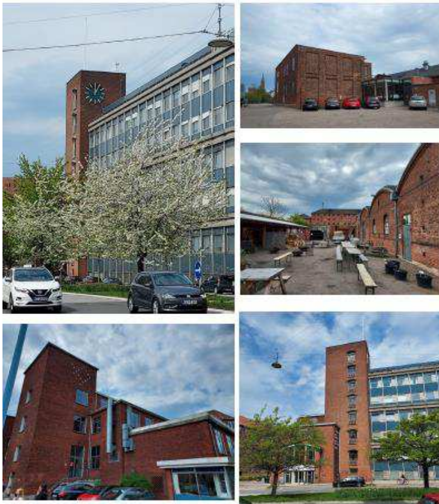
Figur 4 Fotocollage med 5 fotos fra bygningerne på arealet

Den nuværende Hotel- og Restaurantskole har til huse i bygninger, som tidligere husede Aller-koncernen på Vigerslev Allé 12-18.