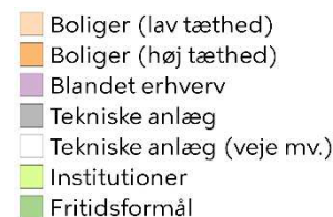
Figur 3: Signaturforklaring til Figur 2