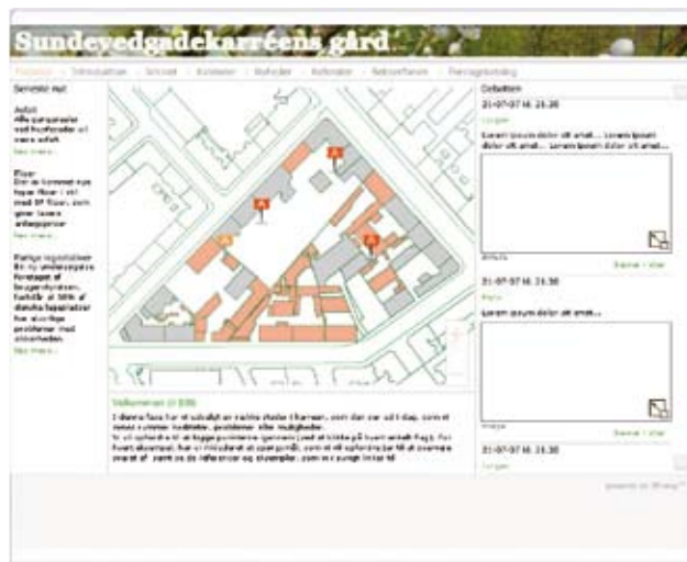
Visning fra foreløbig hjemmeside