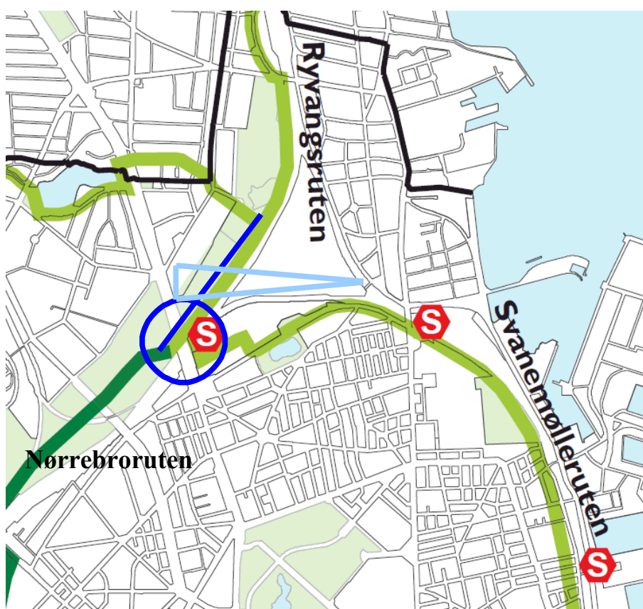
Figur 3 Udsnit af det grønne cykelrutenet. Broen er markeret med en blå streg i den blå cirkel, som markerer, hvor de tre grønne cykelruter: Nørrebro-ruten, Svanemølleruten og Ryvangsruten mødes. Den ansøgte bro vil være placeret over Helsingørmotorvejen/Lyngbyvej i forlængelse af Nørrebro-ruten, der er markeret med den mørkegrønne streg. Den kommende Nordhavnsvej vil skitsemæssigt være placeret indenfor den lyseblå trekants område.

placering lige der, hvor de tre grønne cykelruter: Nørrebro-ruten, Svanemølleruten og Ryvangsruten mødes. Nørrebro ruten er etableret og Svanemølleruten samt Ryvangsruten er planlagte ruter, hvor specielt Svanemølleruten er højt prioriteret. Den ansøgte bro er på Figur 3 markeret med en blå streg, og cykelruters møde er markeret med en blå cirkel. Broens længde illustrerer, at den både krydser Helsingørmotorvejen/Lyngbyvej og Nordhavnsvej. Nordhavnsvejen er ikke indtegnet på dette kort men vil forløbe fra øst og skære sig igennem en korridor, der her skitsemæssigt (og uden målfastsætning) er markeret med en lyseblå trekant.