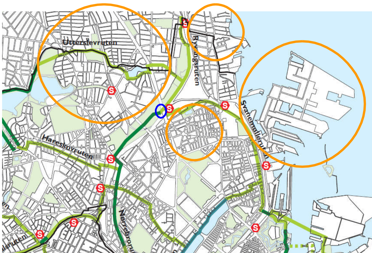
Figur 4 Udsnit af det grønne cykelrutenet. Den blå ring illustrerer der, hvor broen placeres, og hvor de tre grønne cykelruter: Nørrebro (mørkegrøn), Svanemøller (lysegrøn) og Ryvang (lysgrøn) mødes ved Ryparken St. De orange cirkler indikerer skitse-mæssigt broens oplande.

Oplandende er Nørrebro og Bispebjerg området, Hellerup området, Indre Østerbro og de kommende boliger og arbejdspladser på Nordhavn. Oplandende vil have forskelligt potentiale over tid.