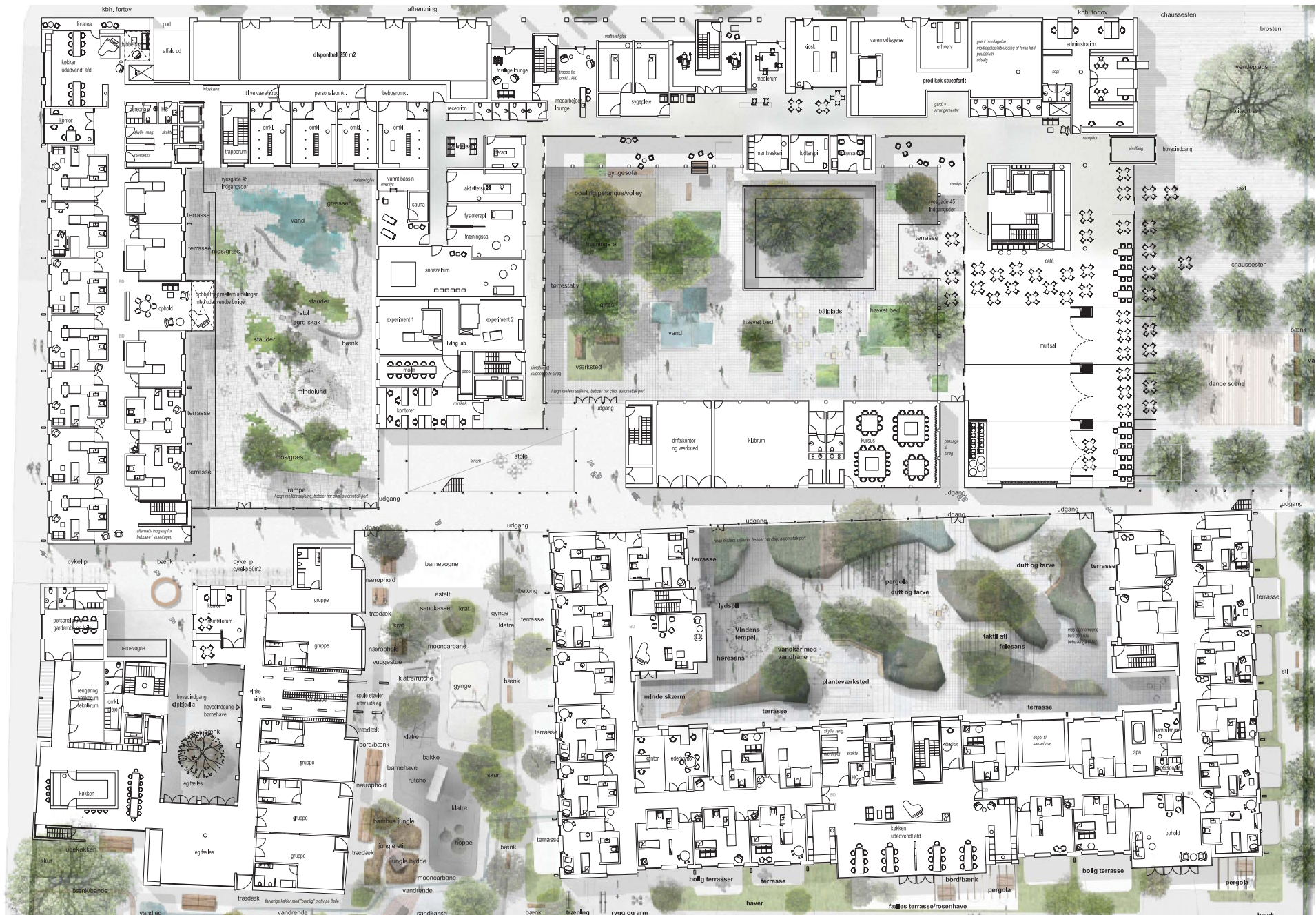
stue plan - ikke i skala