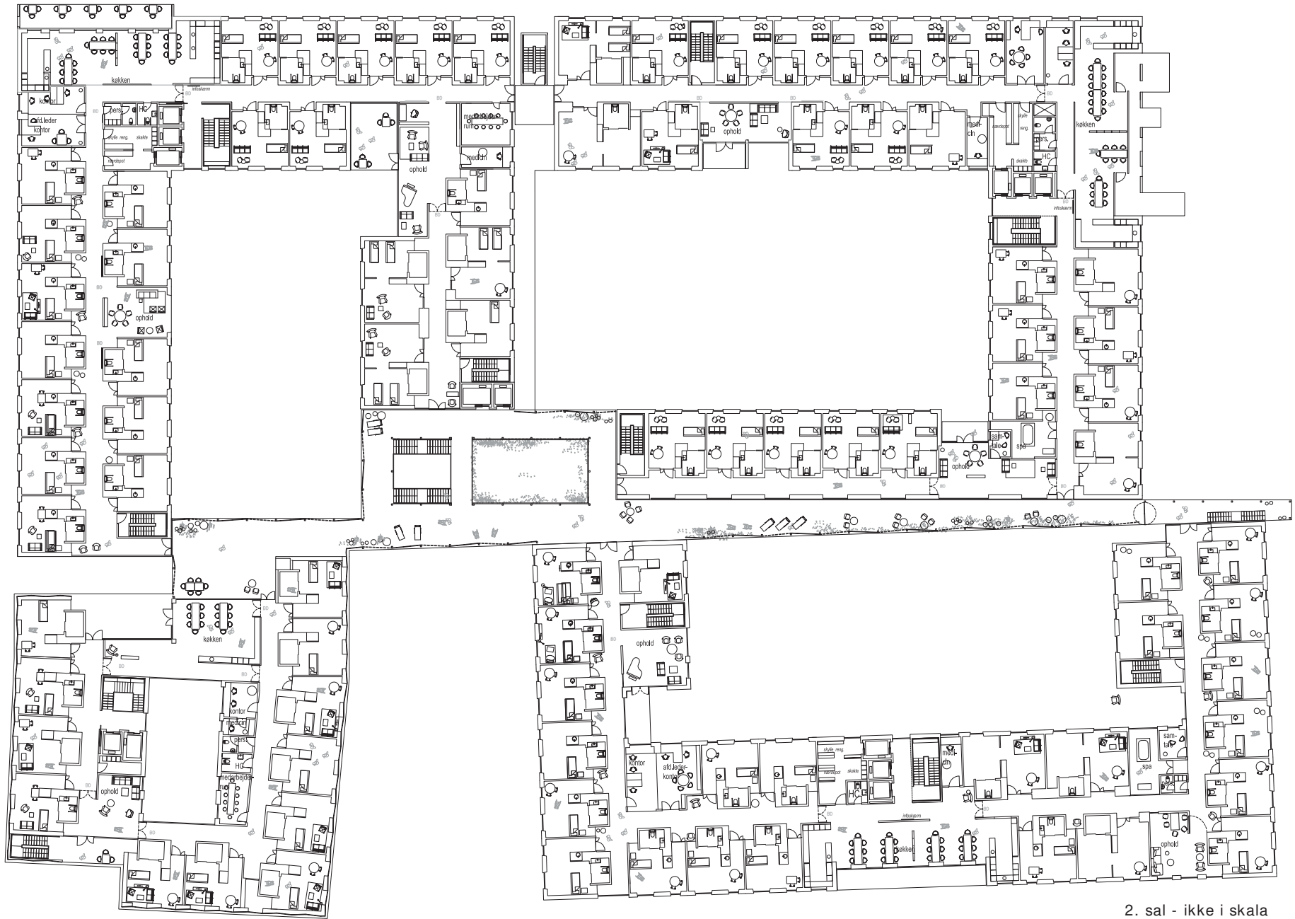
2. sal - ikke i skala