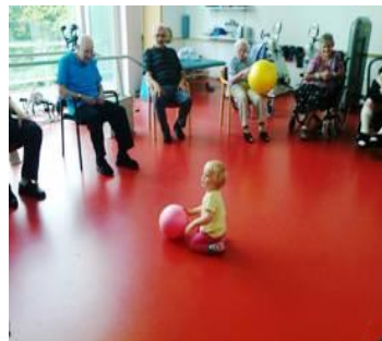
Besøg af personalets børn til gymnastik

Ud over det spontane, og hvad vi nu må finde på, har vi en del faste aktiviteter. Her skal nævnes