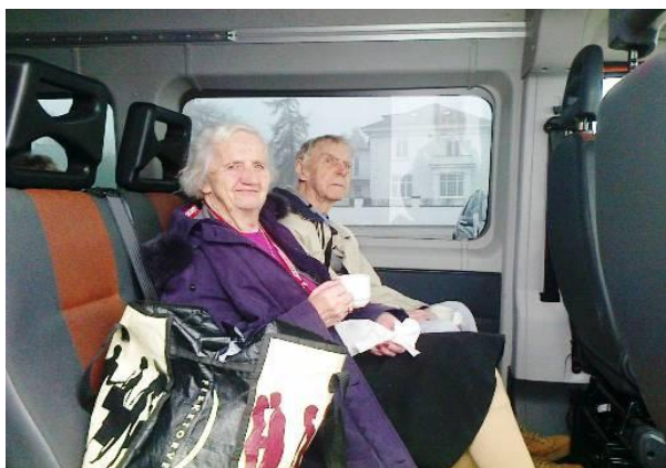
Her ses 2 af vores beboere i bussen på vej "ud i det blå"

Vores bus, er en uundværlig del af hverdagen, på Dronning Ingrid's Hjem. Bussen kører flere gange om ugen til forskellige kulturelle trækplastre rundt omkring i København og omegn. Bussen kan også bruges til fx beboerferier.