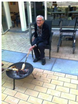
Man bliver aldrig for gammel til snobrød

Vi holder beboermøder og møder i festudvalget. Her planlægger vi div. aktiviteter og fester. Beboernes ønsker vil vi, så vidt det er muligt, tilgodese.