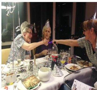
Beboer og personale fejrer nytårsaften

Dronning Ingrid's Hjem holder af kongehuset og vil til hver en given lejlighed, fejre begivenheder i kongehuset.