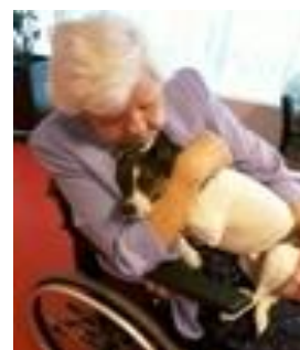
Er der noget som en lille hund?