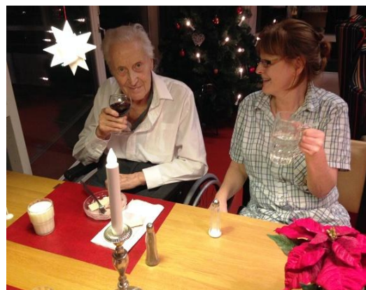
Personale og beboer hygge ved aftenmaden