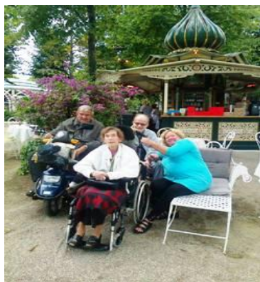
Tivoli er hyggelig om dagen, men om aftenen, kan alle lysene nydes – Det skal beboerne have mulighed for at opleve...

Kulturelle og kulinariske oplevelser, er oplevelser der ofte finder sted i de "tyndtbemandede" timer dvs. efter kl. 15.00./weekend/helligdage