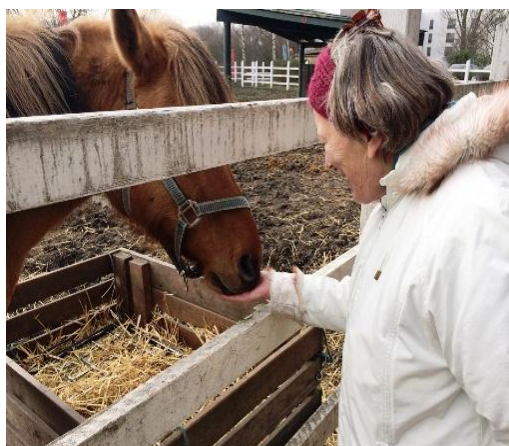
Beboer fodrer hesten på "Karens Minde"

I det daglige, gør personalet meget ud af at hverdagen så vidt, det er muligt, afspejler de ønsker vores beboere har til aktivitet. Det handler om at gøre noget særligt ud af måltiderne, skabe hjemlig hygge i grupperne, men også tid til fx små gåture