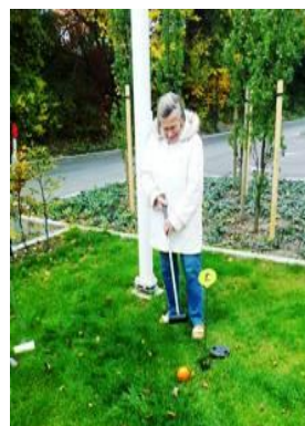
Et slag Krolf.....