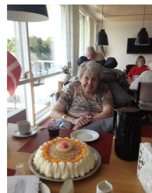
En beboer fejrer sin fødselsdag

Intet er vigtigere end, at give vores beboere en meningsfuld hverdag, præget af aktiviteter der skaber glæde og appetit på livet.