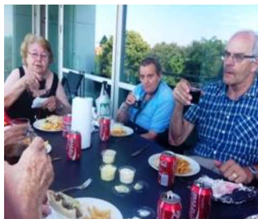
Pommes frites, shawarma og cola – nogen tager det for givet, men kan man også få det på et dansk plejehjem, hvis man har lyst? – På Dronning Ingrid's Hjem kan du, og det vil vi gerne kunne tilbyde mere af!

Det er et stort ønske at få mere "liv" på plejehjemmet efter kl. 15.00.