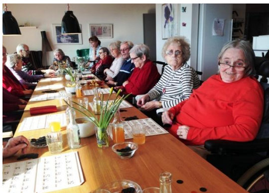
Stor koncentration til banko