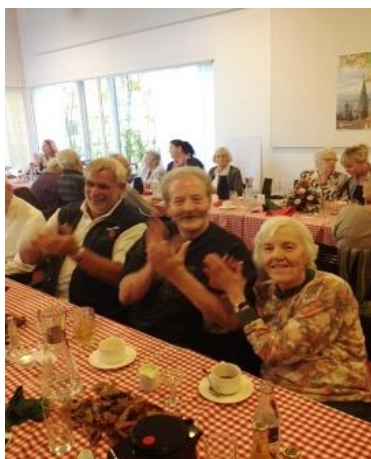
Her er vi til oktoberfest med tyrolersang, wienerschnitzel, ternede duge og fadøl

Der holdes store fester flere gange om året i vores store fælles festsal. Her serveres festmiddage, der tilpasses festen eventuelle tema. Ofte har vi underholdning, til disse arrangementer. Det kan være både kendte og mindre kendte kunstnere.