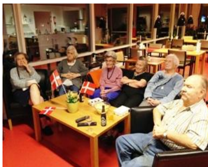
Spænding under en håndboldlandskamp

Vi planlægger, så vidt det overhovedet er muligt fest, aktiviteter og menu ud fra de ønsker vores beboere har.