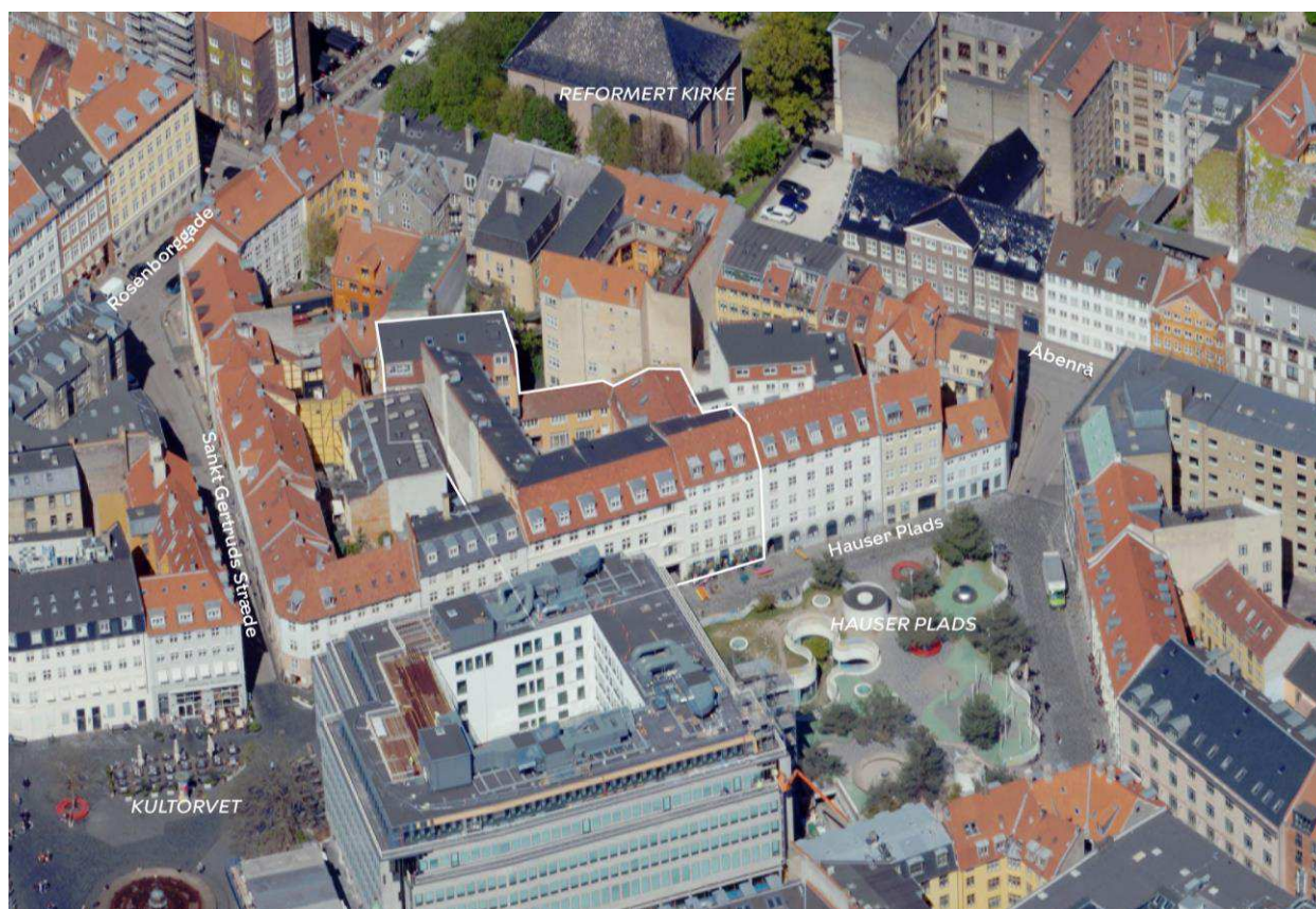
Området set mod nord. Lokalplanområdet er indtegnet med hvid linje, og de vigtigste gader, pladser og bygninger er navngivet. Luftfoto: SDFE, 2023.

Området ønskes udviklet til erhvervsanvendelse (boliger kan bibeholdes), taget på det østlige sidehus ønskes hævet med ca. 1 m og tilført nye kviste. I eksisterende indre gårdrum planlægges for en ny enetages tilbygning, og der planlægges for facadeændringer af eksisterende facade mod gade og mod gård.