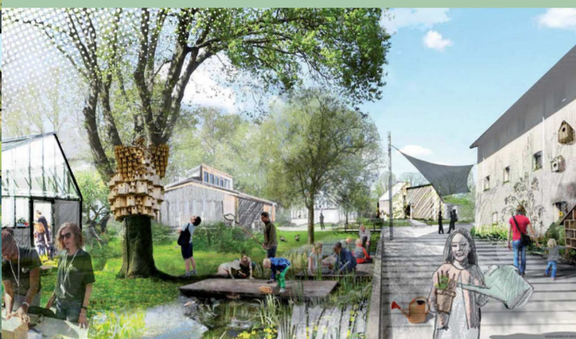
Elselina Van Melle / EVM Landskab

Vi arbejder for at fremme kendskabet til og brugen af scenen. Allerede nu er der en variation af arrangementer på scenen med optrædende fra Det Kongelige Teater, Cirkus Vanløse og musikfestivalen En sommerdag på Bellahøj.