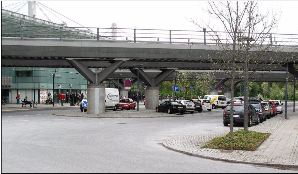
Figur 1: Foto af eksisterende forplads til Flintholm station set fra nord-østlig indkørsel