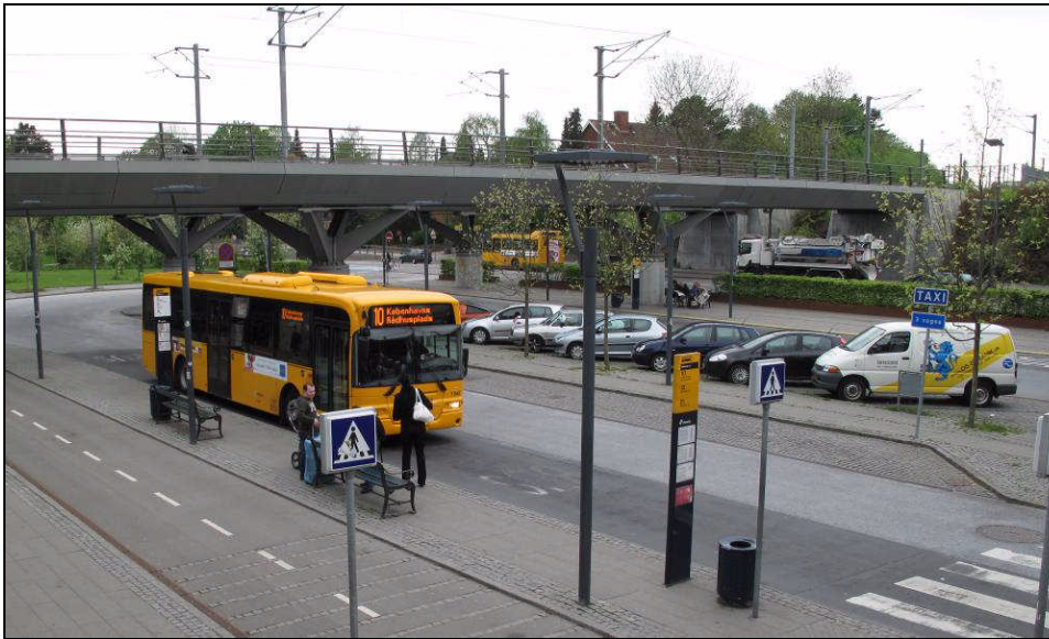
Figur 2: Foto af eksisterende forplads til Flintholm Station set fra syd-øst

Nedenfor er en skitse af, hvordan forpladsen kan indrettes, så der bliver plads til flere busser. Der etableres en bus-ø i midten af forpladsen, der både muliggør flere busser, men også muliggør gode og overskuelige skiftetilstande mellem busserne. Desuden etableres nyt lys-signal ved den vestlige indkørsel til stationen (venstre side af illustration)